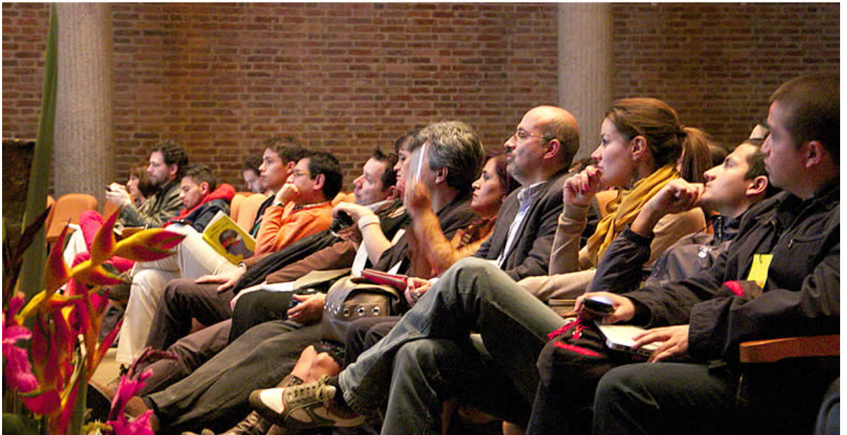
La jornada de conferencias fue muy valorada por los asistentes.