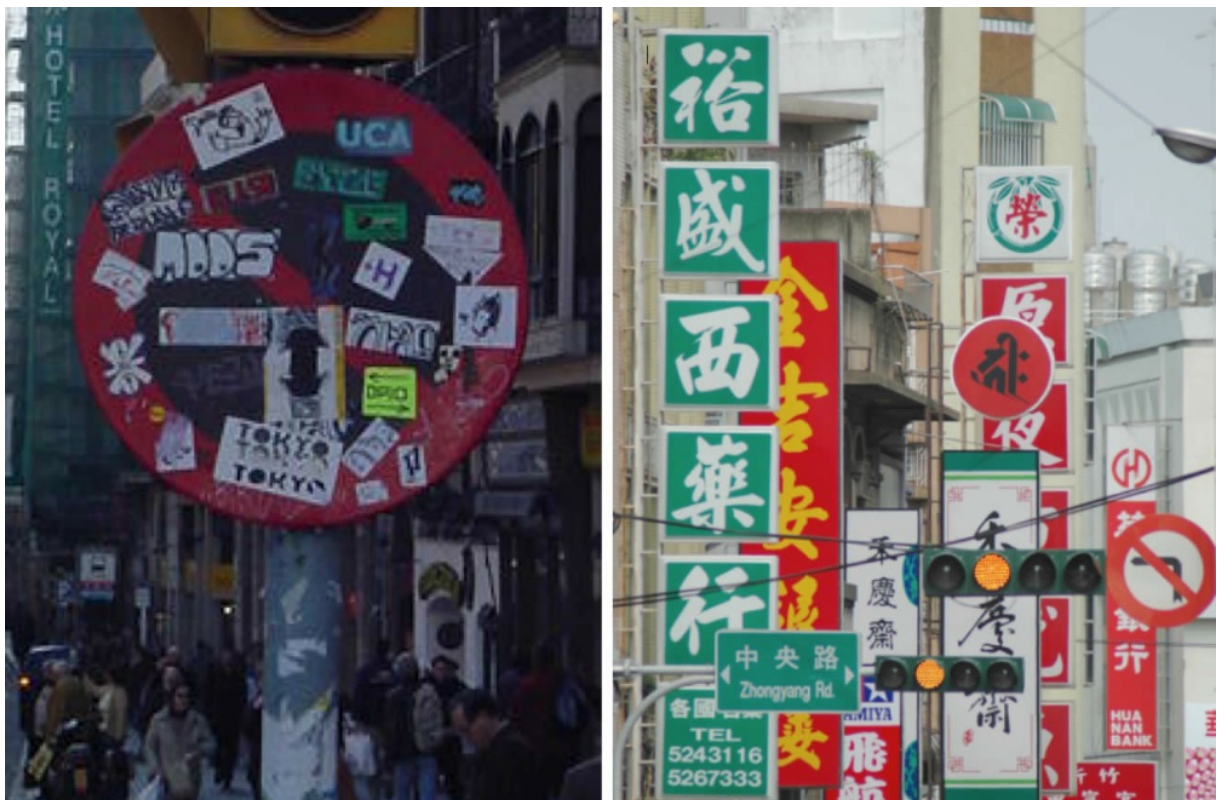
A la izquierda, parásitos presentes en una señal de Barcelona. A la derecha, competencia para llamar la atención entre señales en una calle de Taipéi, Taiwan.