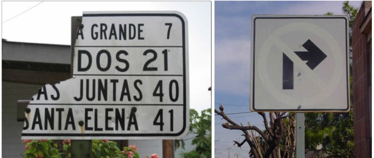
A la izquierda, señal atacada por depredador en Costa Rica. A la derecha, señal afectada por la luz solar.

competencia por el espacio (entorno donde se competirá); □ el alimento (sea dinero, tiempo o espacio); la pareja (complementos que se relacionan con el elemento); los parásitos (todo elemento añadidos a la propuesta inicial); y la enfermedad (deterioro natural por ausencia de mantenimiento); y otros, afectarán los resultados que influirán en la selección, supervivencia o muerte del diseño.