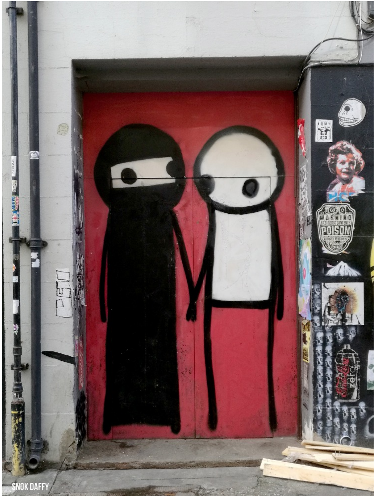
Obra de Stik

Sin lugar a duda Brick Lane es un lugar imperdible que me renovó el amor por el arte y por el diseño. Ampliar tus horizontes te ayuda o a reconocer lo bueno que tienes y lo maravilloso que te falta por descubrir. Invité a los lectores a buscar otras obras de estos artistas y si tienen la oportunidad de viajar a Londres, les recomiendo darse una vuelta a este sitio inspirador para los artistas gráficos.