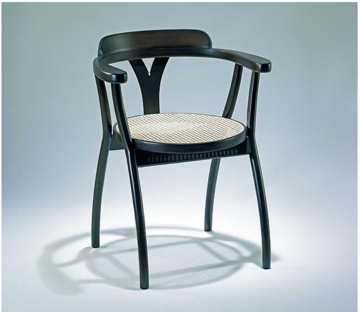
Fotografía de la pieza definitiva

En definitiva, esta butaca no intenta cubrir «un nicho de mercado» como se plantea actualmente, sino recuperar una sensación de pertenencia histórica a través de los materiales y la imagen, no refritada sino una interpretación actualizada de un superclásico como es una Thonet y la razón de su diseño no es la necesidad de la gente de tener una nueva silla para elegir, sino que su razón de ser es la necesidad del diseñador de hacer una silla.