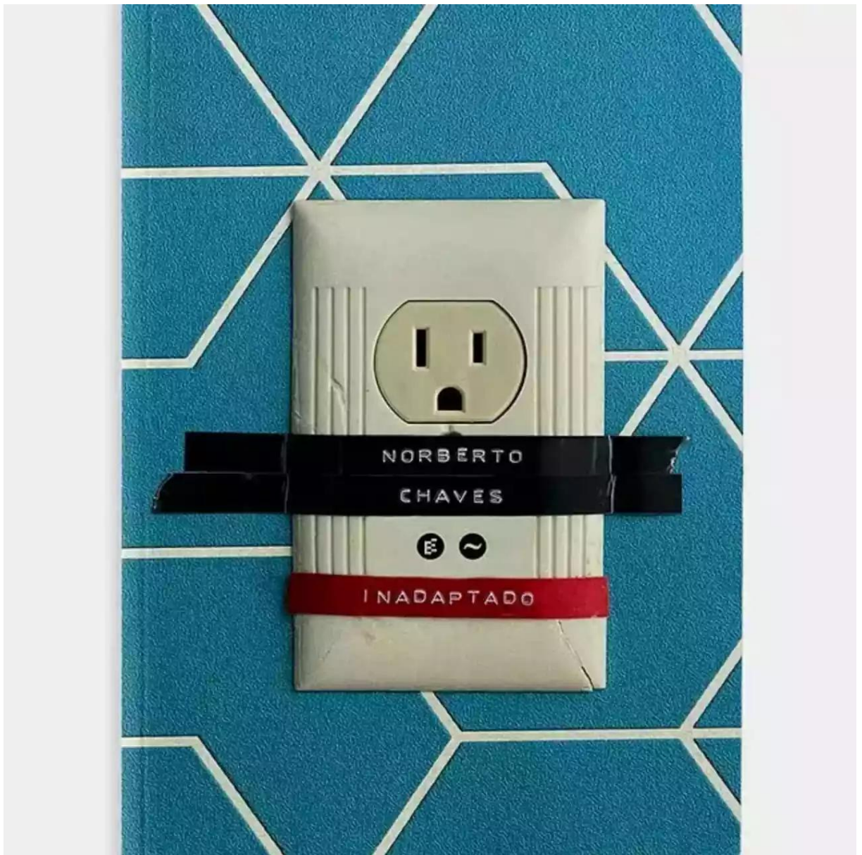
Tapa de la edición argentina de Inadaptado, publicada por Wolkowicz Editores.

Sobran patrocinadores a la adaptabilidad. Pero ¿qué haces si tu entorno desentona? Norberto Chaves lo fundamenta con su más ácida lucidez en el nuevo libro «INADAPTADO».