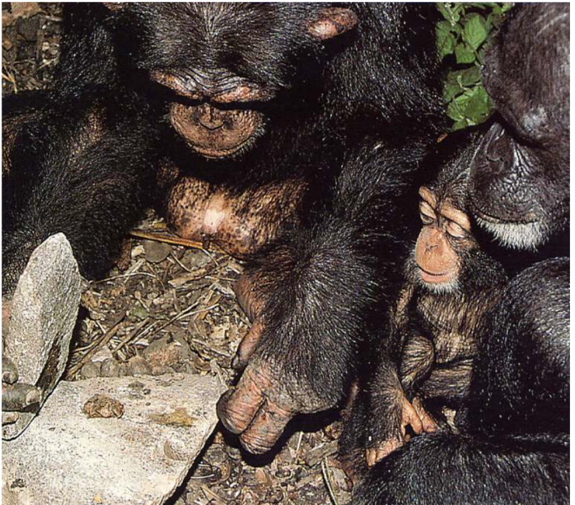
Chimpancé enseñando cómo se usa el martillo y el yunque (Foto: Bromhall-OSF/Bios).