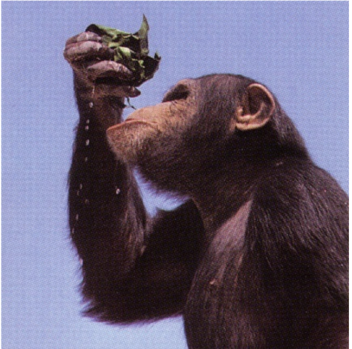
Chimpancé bebiendo agua con esponja de hojas.