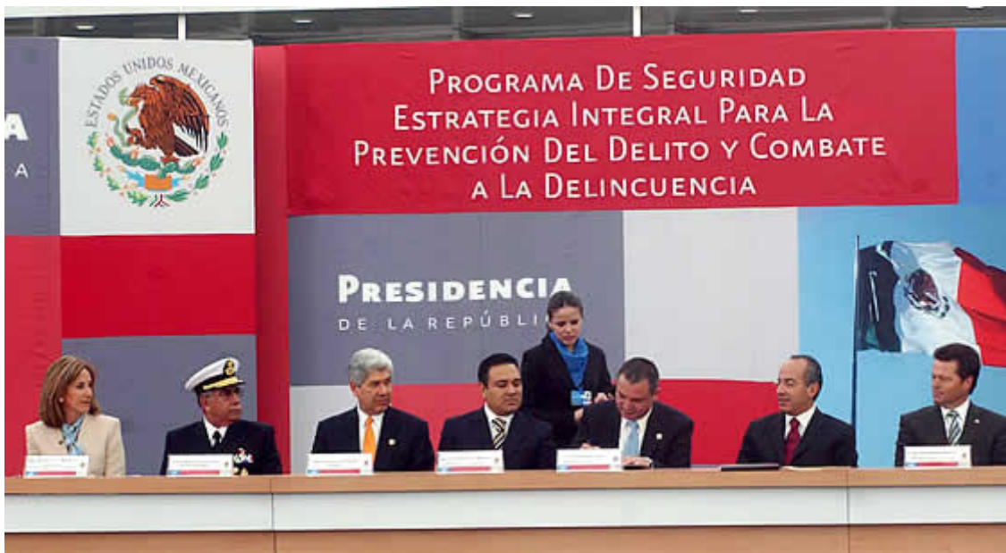
Back para acto oficial.