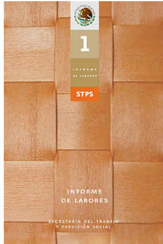
Portadas de documentos, primer informe de labores.