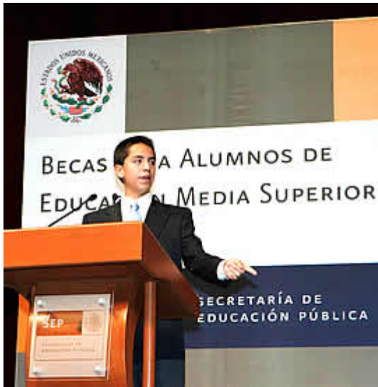
Back para acto oficial.