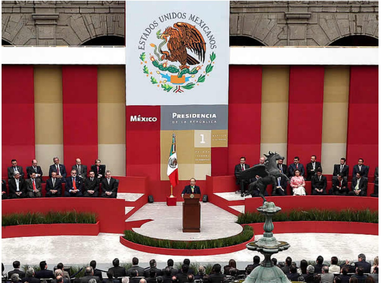
Sesión de presentación, primer informe de labores (México, 2007).