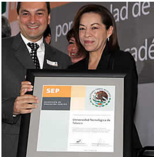
Entrega de reconocimientos de parte de la Secretaría de Educación Pública.