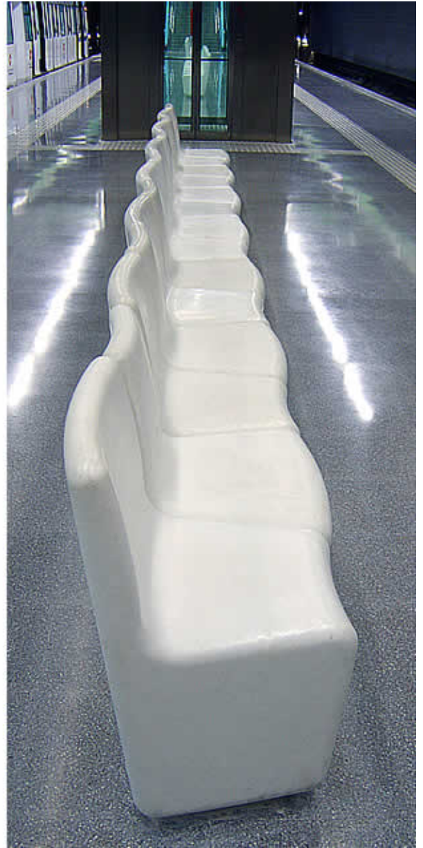
Bancos DOVE colocados en el metro de Barcelona.