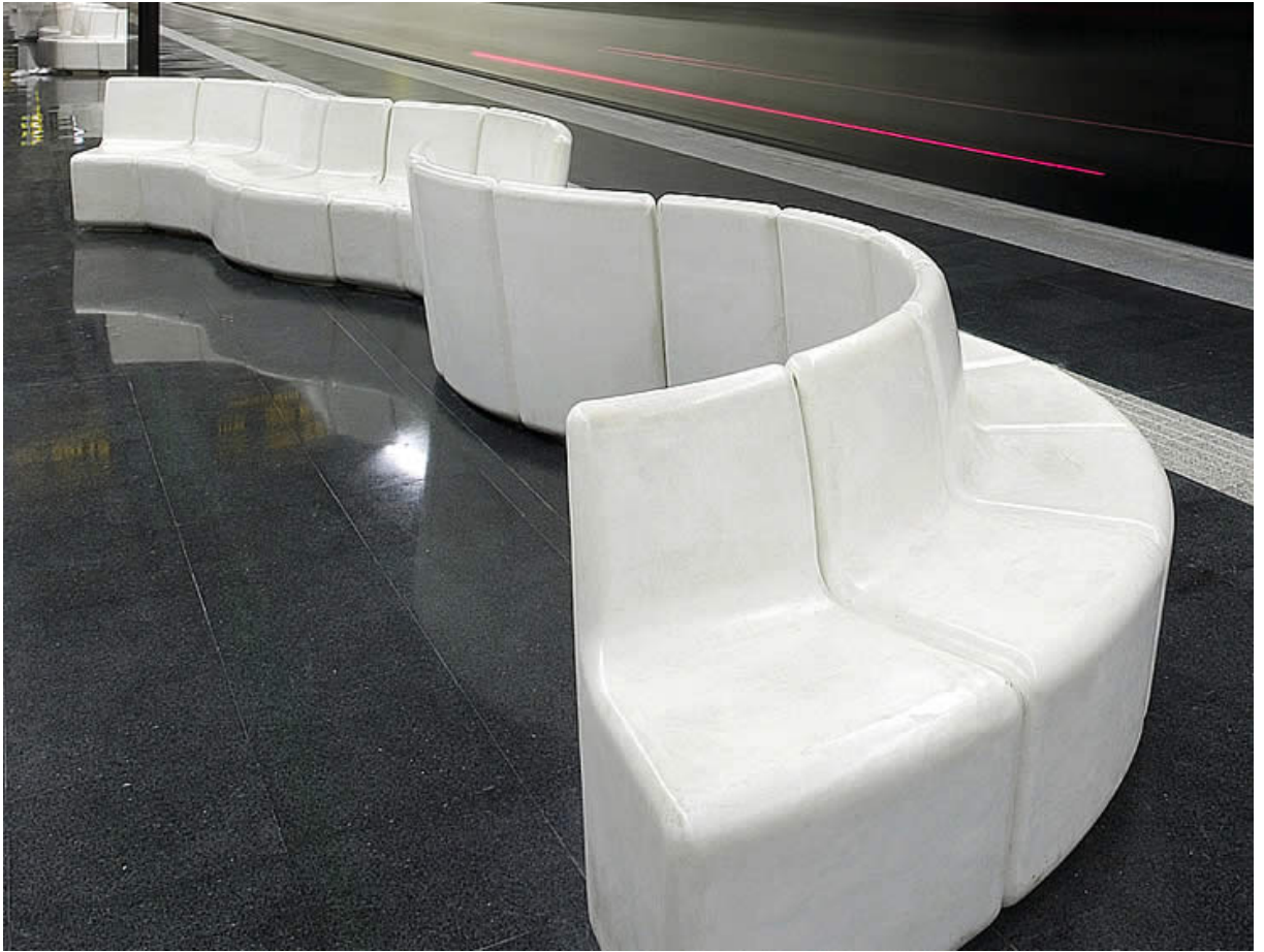
Bancos DOVE colocados en el metro de Barcelona.