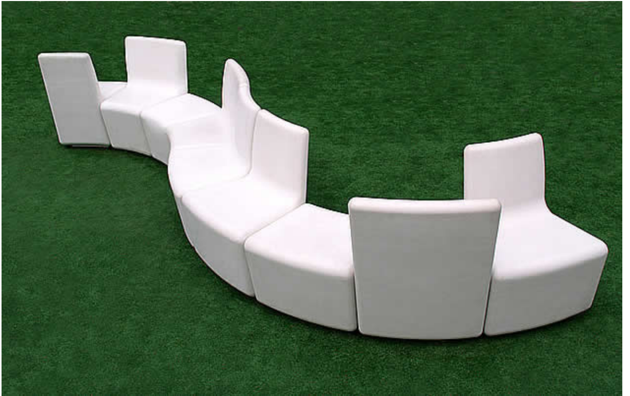
Presentación de los bancos DOVE en CONSTRUMAT 07.