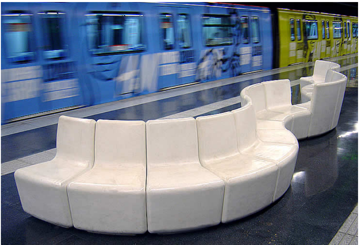
Bancos DOVE colocados en el metro de Barcelona.