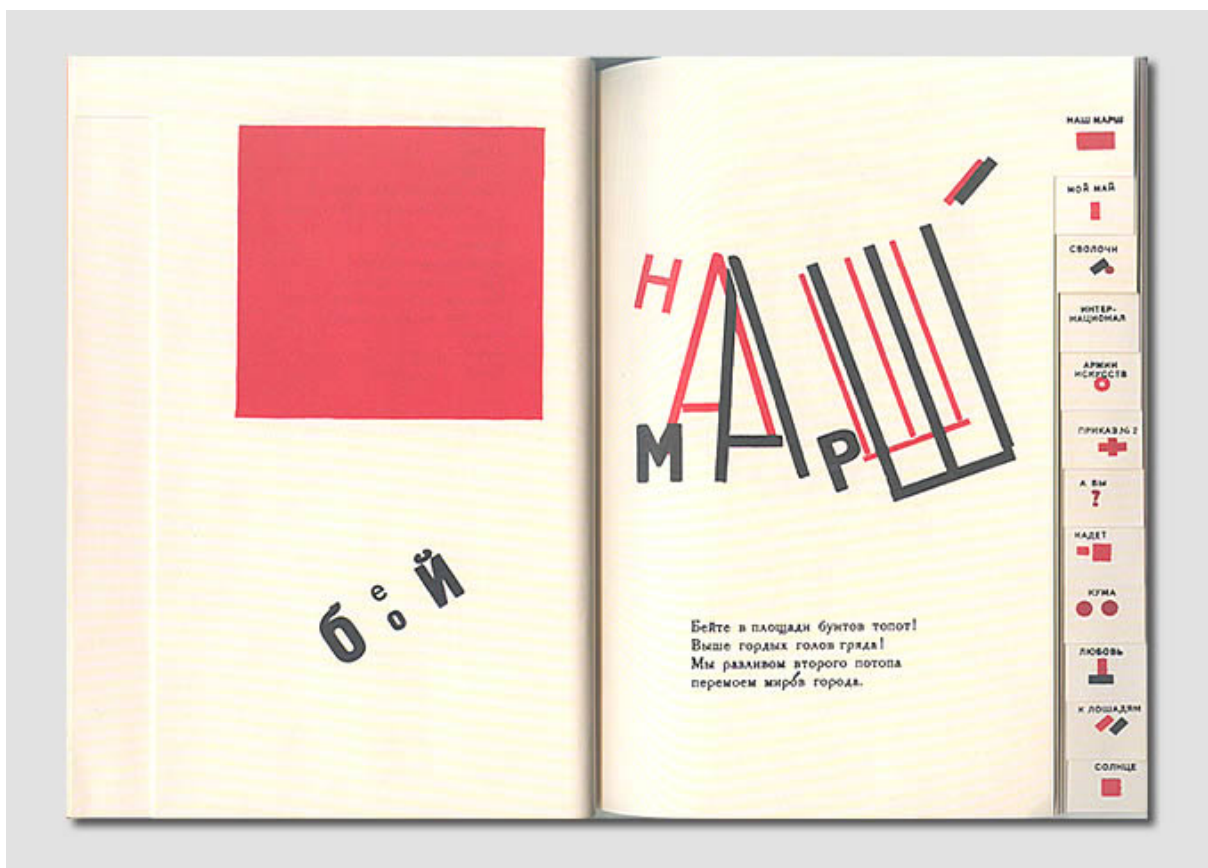
Doble página «Nuestra marcha», del libro Para la voz, por Vladimir Mayakovsky y El Lissitzky (1923).

Así, un poemario es una colección de poemas —libro, publicación, objeto— cuyo sentido de unidad, balance y ritmo lo decide un poeta, por los temas tratados, la forma de construcción de los poemas, por sus referencias e imágenes, entre otros rasgos. En suma, según estas observaciones, la poesía es un hecho plural, el poema designa un texto particular y el poemario es una colección que agrupa los poemas. Además, esta colección se materializa en una publicación con cualidades formales específicas —incluso materiales y de encuadernación—, que en muchos casos reverberan el contenido poético, la disposición de cada página y demás elementos editoriales.