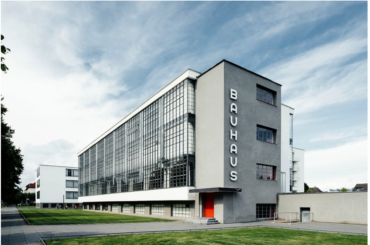
Edificio de la Bauhaus en Dessau (1925/1926).

En sus experimentos, en sus audaces innovaciones se abandonó el modelo esteticista de la época, y se propuso otro basado en el valor de la máquina, y la formación de un hombre nuevo. La Bauhaus fue un crisol donde se fundieron las ideas de personajes de la talla de Walter Gropius, Paul Klee, Vasili Kandisky, Johannes Itten, y tantos otros, para producir un verdadero cisma que sacudió los cimientos del diseño contemporáneo y cuyos fundamentos aún hoy podemos encontrarlos en el espíritu que alimenta los MediaLabs en diferentes partes del mundo.