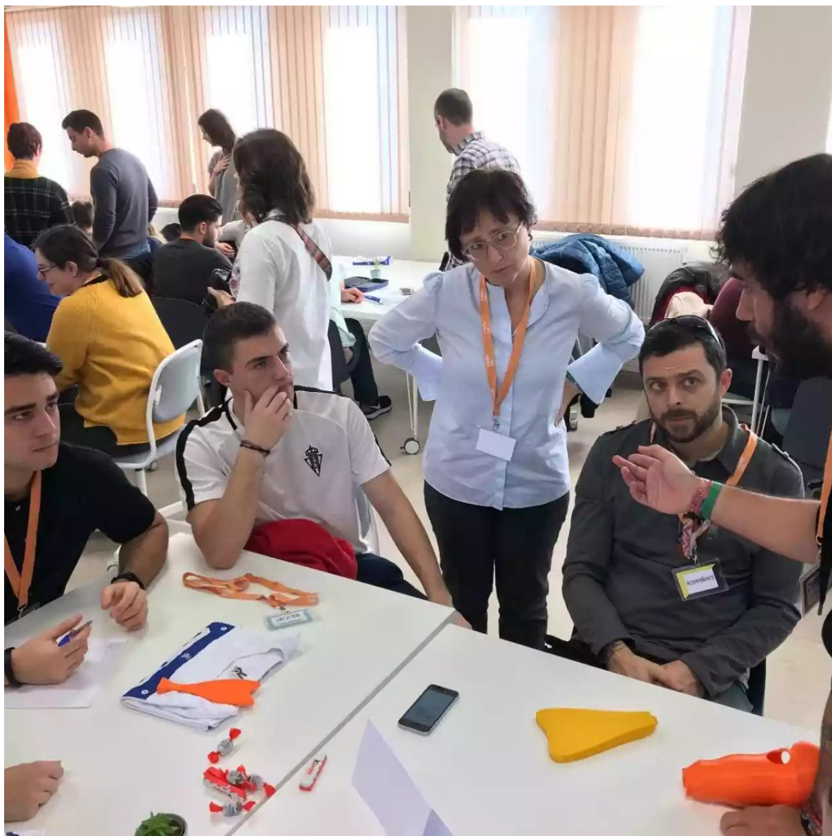
Proyecto Supergiz. Autofabricantes. MediaLab Uniovi

Una mirada sobre nuevos abordajes en el diseño.