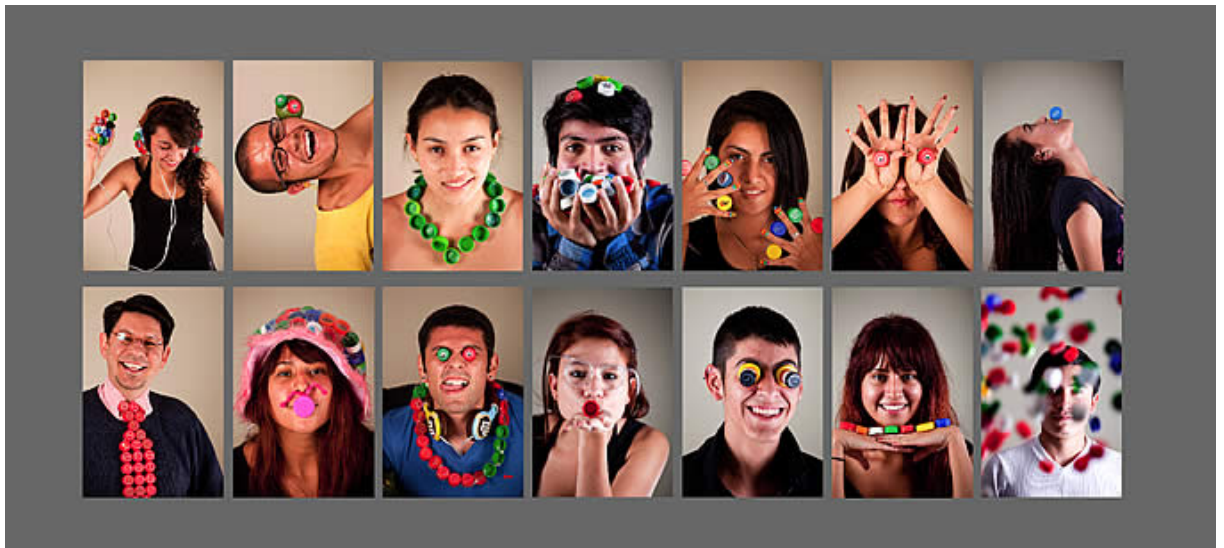
Exploración de estudiantes de la asignatura Teoría de Diseño.

Partiendo de esta conciencia ambiental, se están realizando ejercicios académicos en los que se explora en clase el diseño de proyectos pensados desde su origen para ser concebidos con material reutilizable o para ser reciclados al terminar su propósito académico. En un workshop realizado por el programa de Diseño Industrial Tadeísta de Bogotá 7 , se construyeron con las tapas de botellas plásticas y varios tipos de cartones algunas maquetas verdes de buena factura que posibilitaron el trabajo de los conceptos disciplinares de Objeto, Contexto e Interacción, retomados del plan de estudios. Después de cumplir con sus objetivos, permitieron implementar la «Fase de Reciclaje», cuando los involucrados en el proyecto (estudiantes, profesores y funcionarios de la universidad) separaron ellos mismos la mayoría del material, para terminar donándolo a la Fundación Sanar que los recicla como una forma de obtener recursos para implementar sus programas de ayuda a niños.