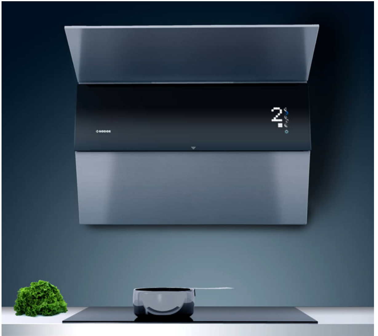
Vista frontal de la campana de planos articulados