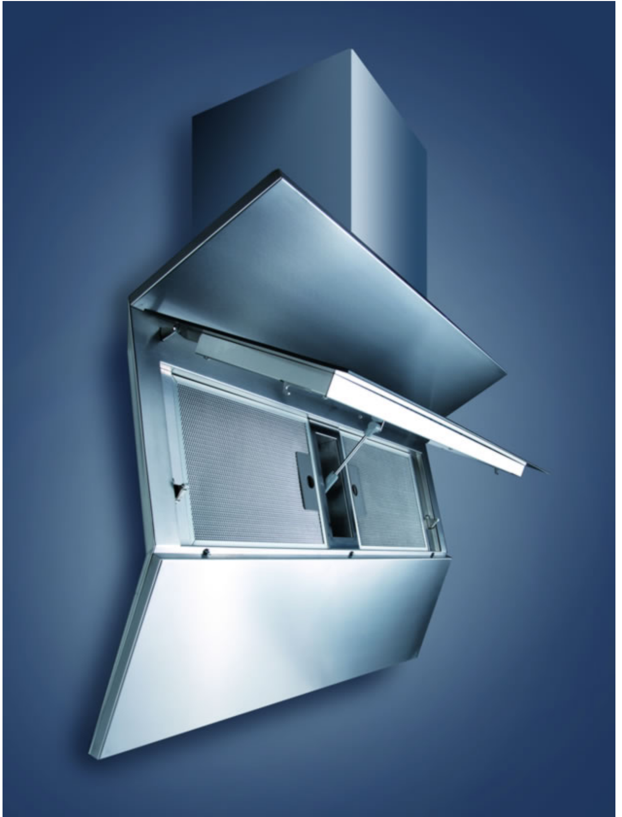
Vista lateral de la campana de planos articulados

El articulado de planos, extrapolado a la técnica, permite un sistema de absorción de humo perimetral, aumentando de forma considerable la eficiencia del grupo motor con que va equipado la campana.