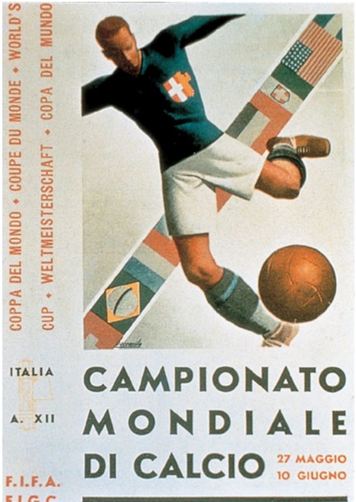
Italia 1934. ITALIA A. XII se refiere a 12 años de Fascismo en Italia.

Uno de mis carteles favoritos, tal porque soy mexicano, es el de México 1970, en el que aparece la misma tipografía utilizada en las Olimpiadas de México 68. En este cartel puede observarse una eficiente abstracción de los polígonos y hexágonos del balón, sencillo y bien