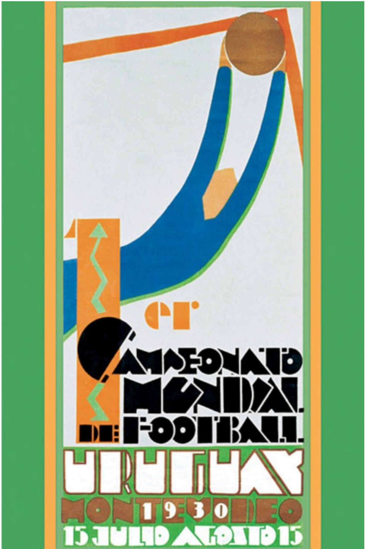
Uruguay 1930 - Guillermo Laborde