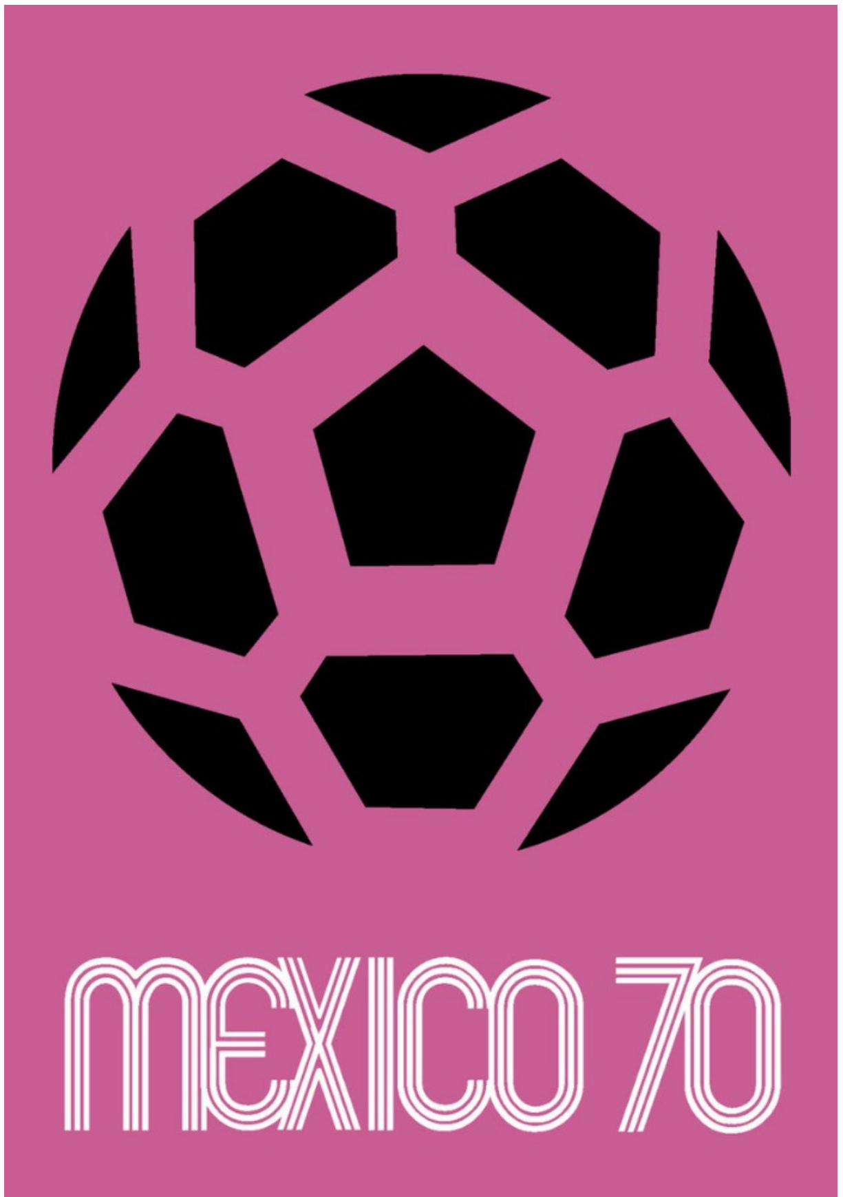
Afiche Mundial México 1970