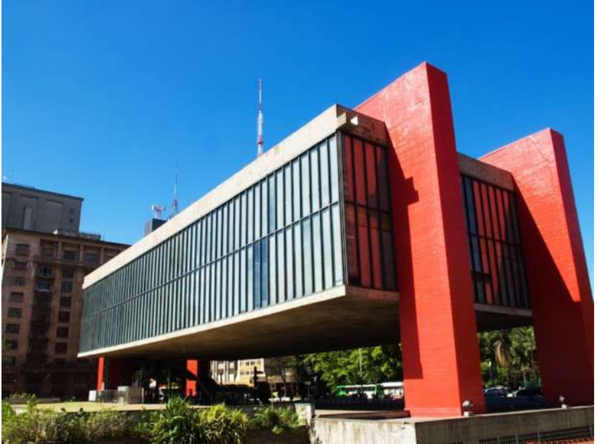
Museo de Arte de São Paulo. Lina Bo Bardi