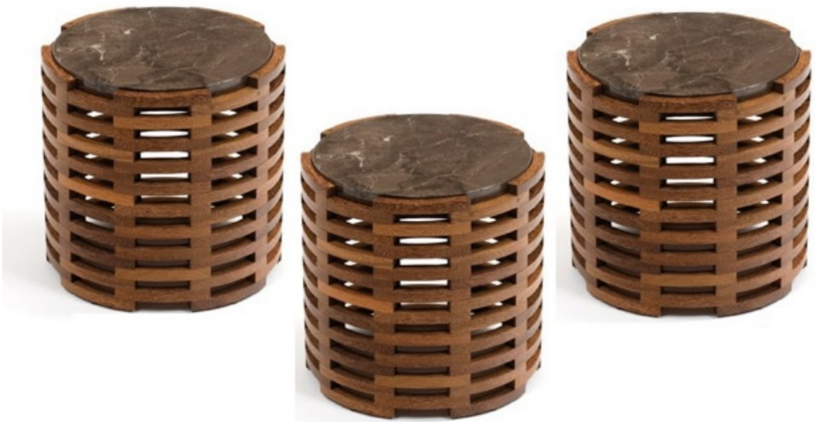
Mesa Lateral María Preciosa . Etel