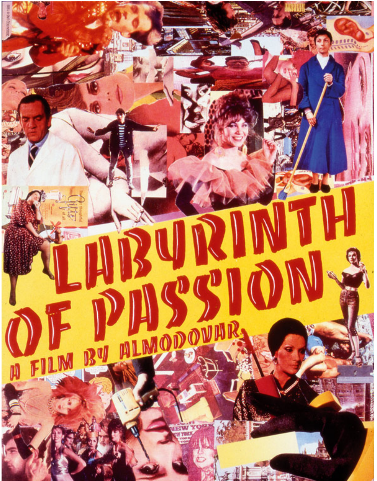
Póster para el lanzamiento en EEUU del film Laberinto de pasiones , de Pedro Almodóvar, 1989