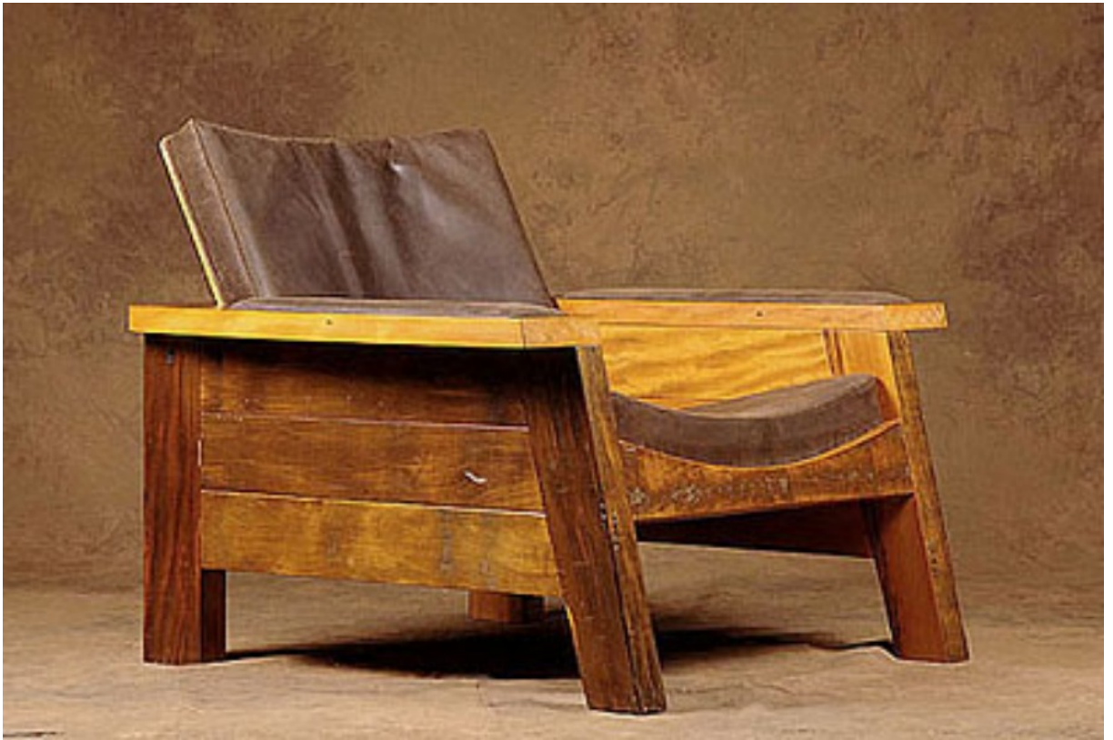
Silla madera reciclada. Carlos Motta