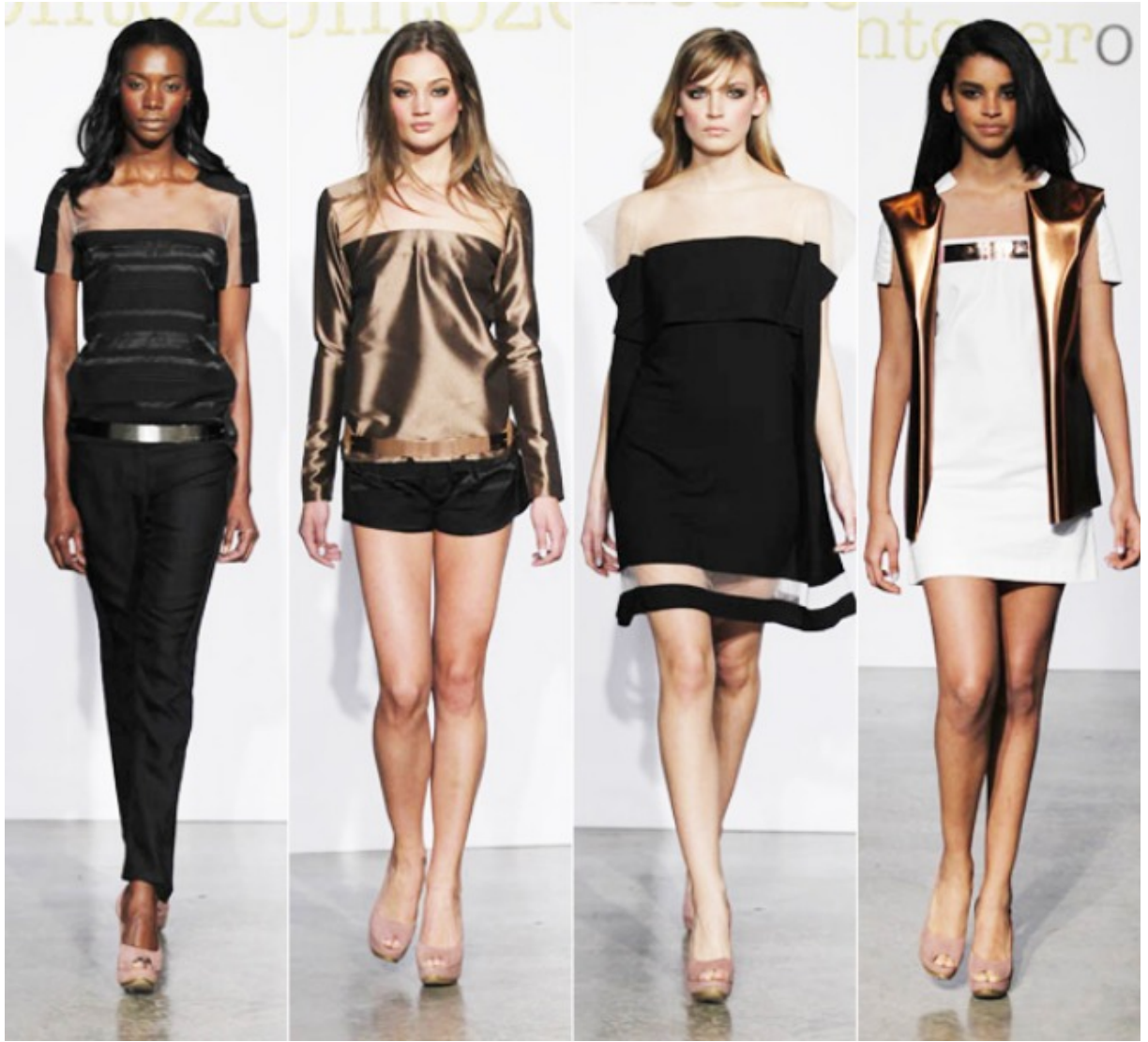
Coleccion. Gabriela Sañate