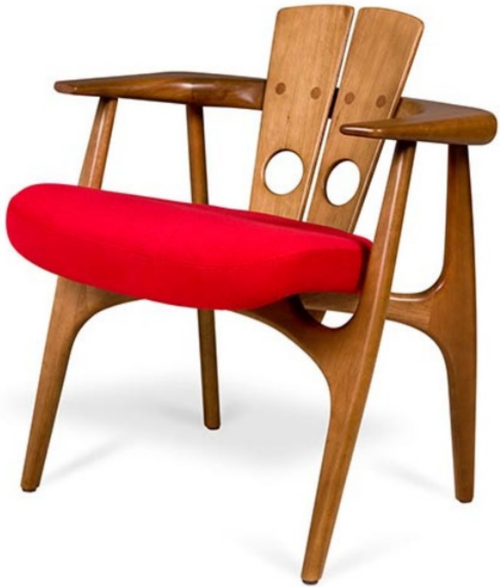
Silla. Sérgio Rodrigues