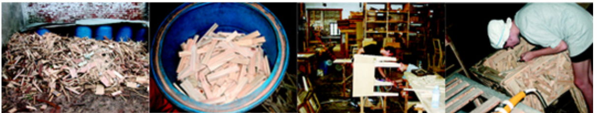
Silla Favela , realizada mediante la superposición de tiras de madera e inspirada en las infraviviendas de las ciudades brasileñas. Hermanos Campana.