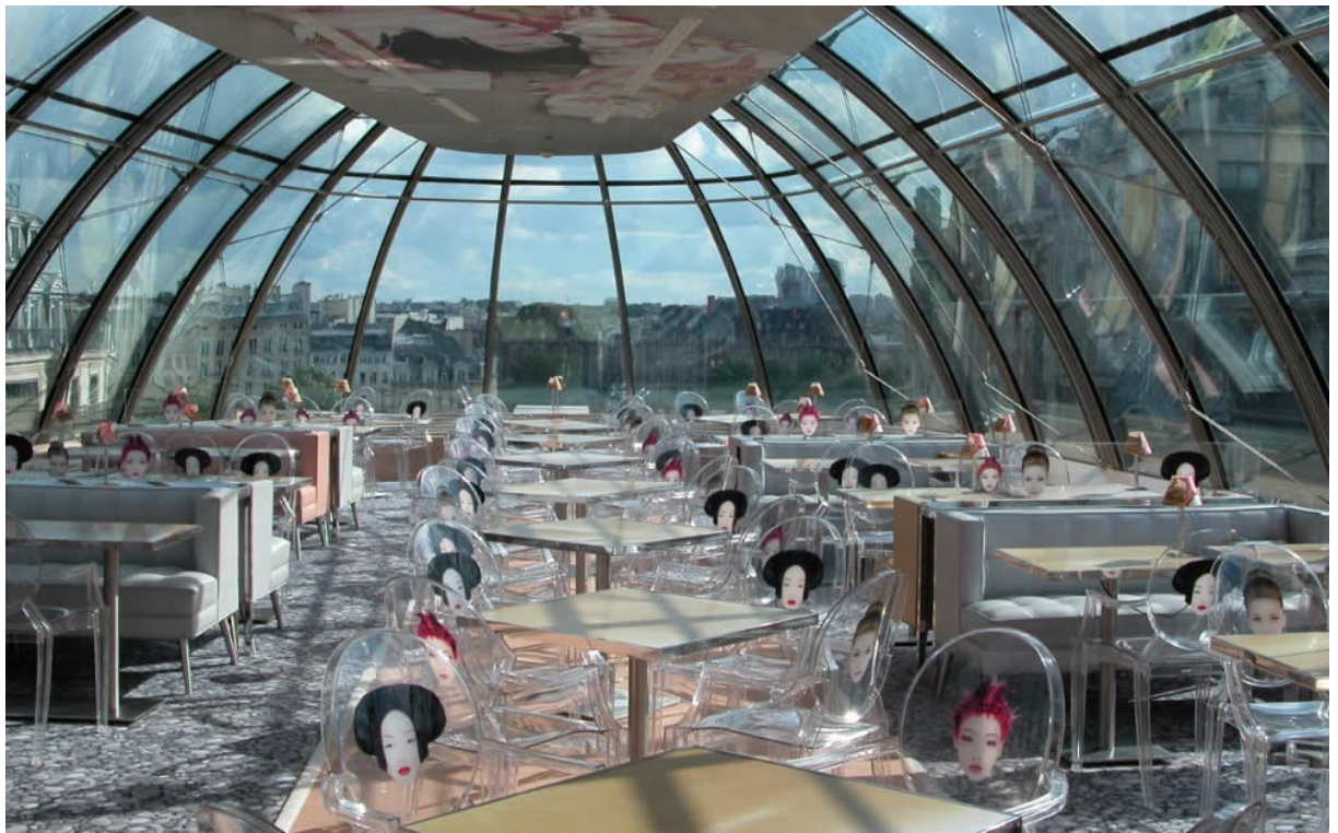
Restaurante Kong de París diseñado por Phillippe Starck.

Encontramos genios en las ciencias, en la tecnología, en las artes, la música, la literatura y otras manifestaciones, pero en diseño me resulta difícil calificar a alguien como genio. Puedo pensar de manera inmediata en Phillippe Starck como un gran talento y genio del diseño, por su diversidad y fluida creatividad que marcan estilo en sus productos industriales, arquitectónicos, de interiores. Ha producido gran cantidad de objetos y espacios importantes, trascendentes e icónicos. Se trata de una inteligencia y creatividad genial.