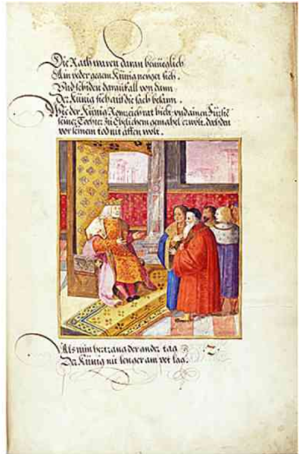
Carátulas de dos los 118 capítulos ricamente ilustrados del Theuerdank.

Cuenta la leyenda que Maximiliano había mantenido su primer «Thewerdanncks» en un ataúd y que lo llevaba en todos sus viajes como un memento mori (un recordatorio de la mortandad de los hombres). Tras su muerte su cuerpo debía ser colocado en el ataúd y extraído de éste —en memoria de sus hazañas— el poema épico para ser difundido para la posteridad.