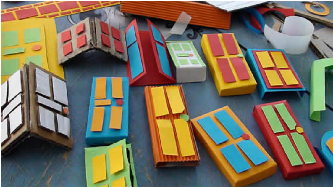
Backstage del stop motion para «Paka Paka de película».

El proyecto fue realizado íntegramente dentro del estudio, por un equipo conformado por siete personas, sin necesidad de contratar ningún servicio externo. La totalidad del proyecto duró aproximadamente 6 meses. Se desarrollaron más de 90 piezas que en conjunto generan un espacio disparatado con leyes propias, construidas con materiales muy cercanos a los niños. Estas «leyes de Paka Paka» fueron el mayor desafío. Para encontrarlas hubo que bucear en los recuerdos, la forma de reconstruir, inventar, jugar y armar de los niños. Los materiales, la imperfección, la posibilidad de que un objeto se resignifique, jugar a hacer con las propias manos, no contaminar la mirada con la madurez y ser maduros a la hora de plasmar en imágenes, además de lograr que el mensaje resulte federal, cercano a los niños, educativo y de gran calidad, todas características distintivas del canal.