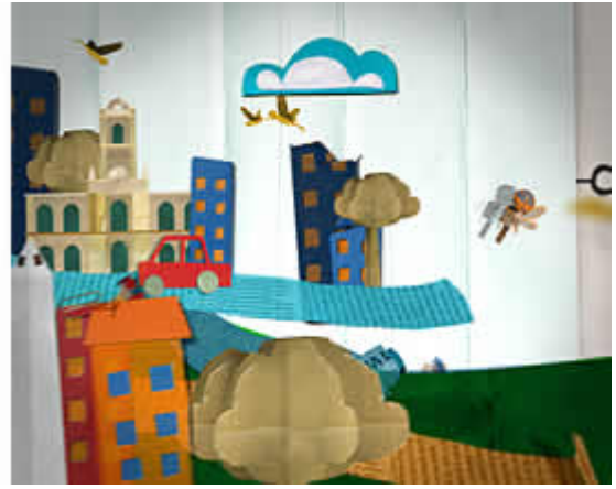
Apertura «Noti PAKAPAKA»