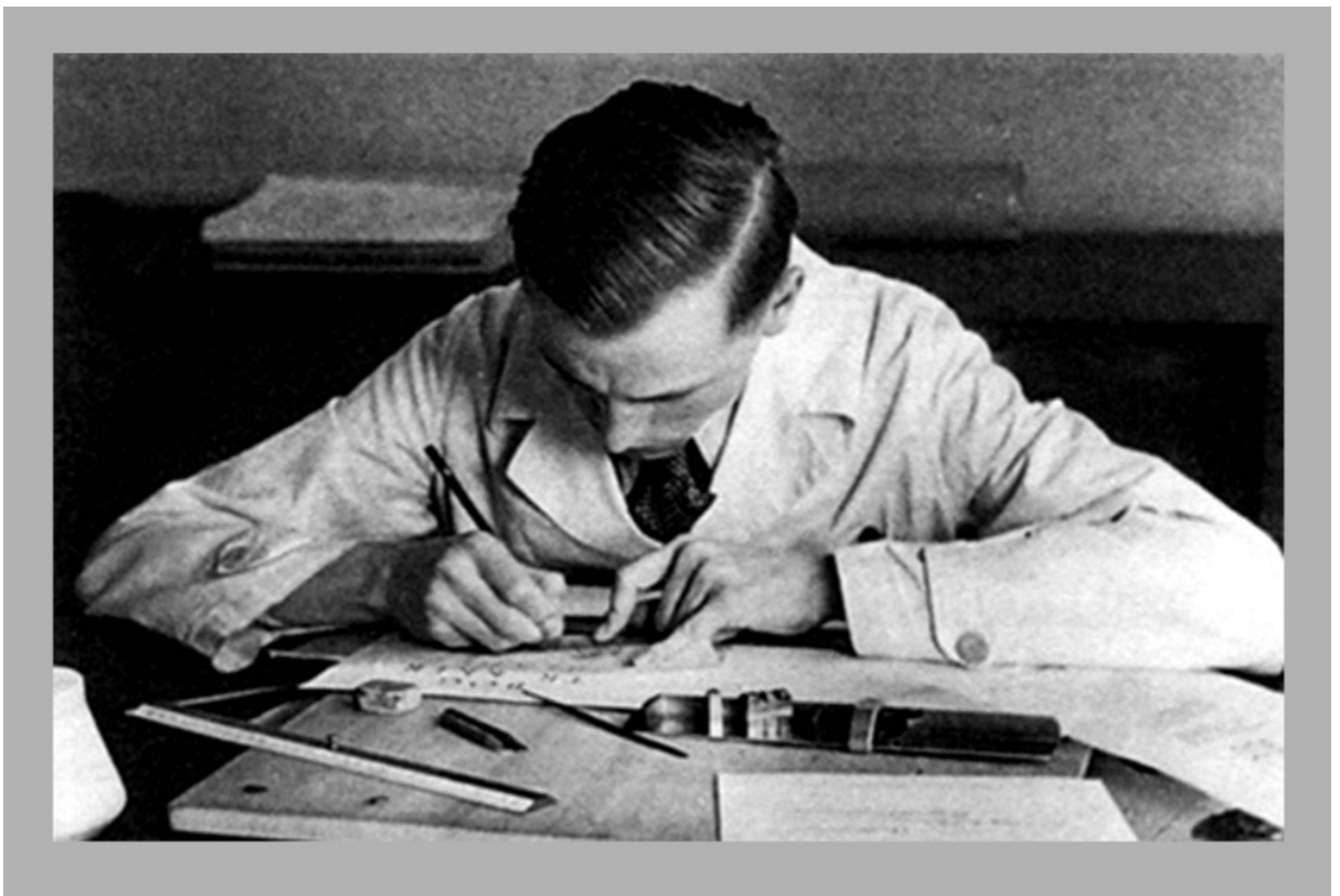
Hermann Zapf, diseñando fuentes con gran precisión desde su juventud.

Desde pequeño comenzó a mostrar sus dotes como tipógrafo, cuando jugaba con su hermano creando un «código secreto» para comunicarse entre ellos, configurado con letras y símbolos parecidos al cirílico y que solo se podían descifrar conociendo un código de encriptación. En la escuela fungió como calígrafo y le animaron a conseguir su primer trabajo como retocador de originales mecánicos en un taller de linotipos. Fue técnico de radios de transistores e instaló sensores de movimiento en su casa, a manera de juego, para que cada vez que alguien abriera una puerta o entrara a un cuarto sonara una alarma.