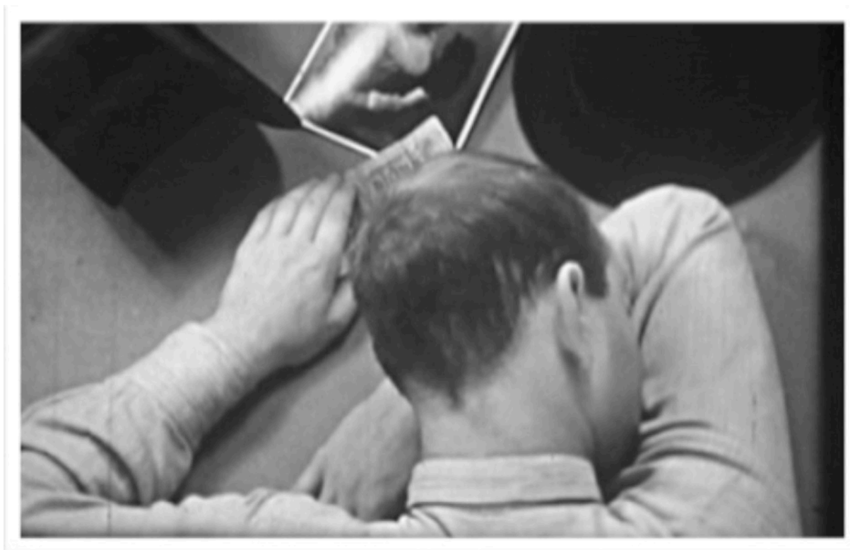
Fotograma de la película Traum (Sueño) filmada en Berlín.

El film Traum (Sueño) filmado en Berlín es un trabajo narrativo de Horacio Coppola, de corta duración, con inspiración en películas de vanguardia de Hans Richter ( Fantasma antes del desayuno , 1928). Con un sentido del humor absurdo y su relato de lógica onírica, se relaciona también con los conceptos cinematográficos del surrealismo y el dadaísmo. Esta película de Horacio Coppola junto con otras dos ( Un dique en el Sena , 1934 y Así nació el obelisco , 1936) no han sido exhibidas públicamente desde hace décadas. Hallados en muy mal estado de conservación, los materiales originales fueron restaurados por Fernando Martín Peña y transferidos a formato digital para su exhibición en el año 2006, en el Museo de Arte Latinoamericano (MALBA).