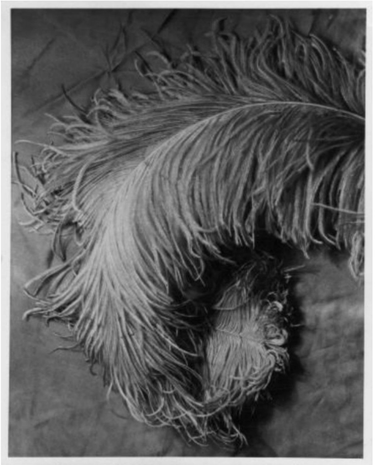
Horacio Coppola, «Pluma», estudio en la clase de Peterhans, Bauhaus, Berlín, 1932. La fotografía fue titulada por Coppola en retrospectiva como: «Feder/Bauhaus, Berlín 1932» (16,1 x 20 cm).