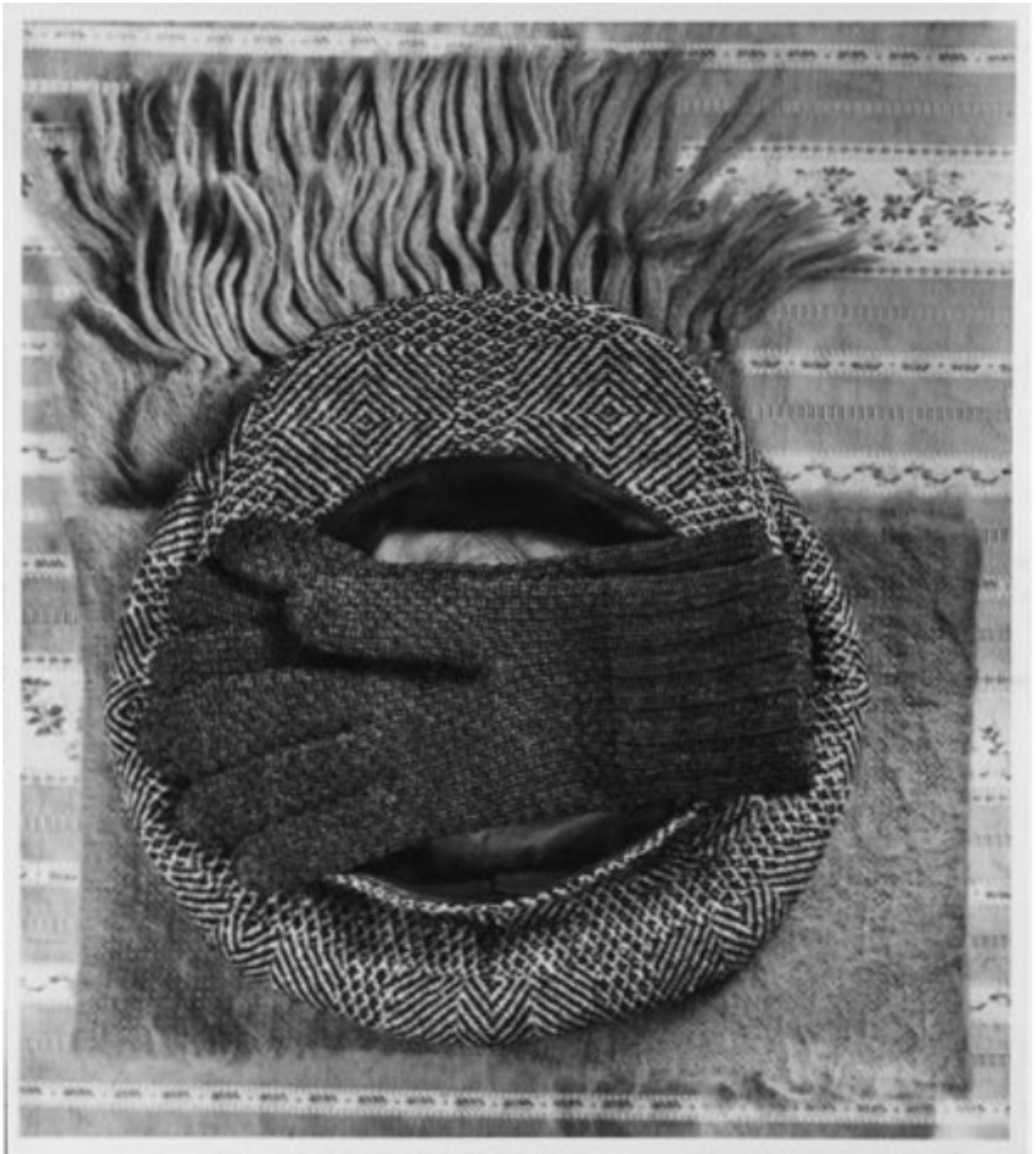
Horacio Coppola, «Winter Hilfe», 1932 Reproducción, Archivo Bauhaus, Berlín. Fotografía Original en Colección Privada

La fotografía fue firmada con tinta y titulada por Coppola en retrospectiva como Winter Hilfe .