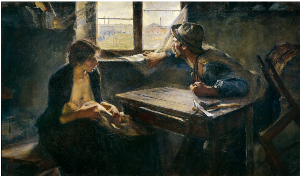
Ernesto de la Cárcova, Sin pan y sin trabajo , 1893-1894 (óleo sobre tela, 125,5 x 216 cm). Museo Nacional de Bellas Artes, Buenos Aires

Sé que lo aquí expresado puede sonar reaccionario y ligado a ese leitmotiv tan repetido y desagradable de «lo pasado fue mejor». No es esa la intención, se los aseguro. Pero cuando veo a mi hija de seis años dibujando, experimentando con líneas y colores el placer de la creación con el propio cuerpo, de gozar de lo sensorial de ese acto que implica el gesto y la acción, y exponer luego ese rastro único y original como una huella dactilar pegando sus dibujos en la heladera, que es su galería de arte; me pregunto ¿en qué momento de su educación la sociedad la va a convencer de que es más relevante el pensamiento y lo conceptual que el acto creativo? ¿Cuándo va a ser que en su cabeza la crítica, la retórica sofisticada, le gane el terreno a la creación y la convenga de que el detalle de un trazo magistral y rápido que captura el gesto en un retrato, o esa mancha sutil en la punta de una nariz o el brillo de un ojo, no son lo bastante interesantes sin el apoyo de un discurso?