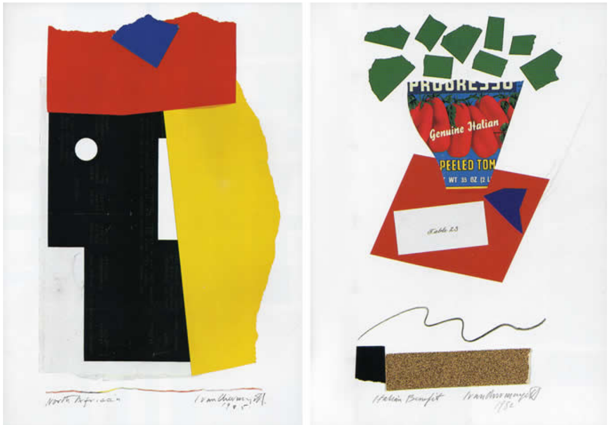
A la izquierda: Italian Benefit (1982). A la derecha: North African (1985).

En ocasión de la presentación de la obra gráfica del diseñador inglés Ivan Chermayeff, publicada en 1990 en la recordada revista japonesa Creation , el diseñador japonés Ikko Tanaka dedicó las siguientes líneas, —en forma de prólogo, en japonés e inglés—, plenas de observación, respeto y devoción a la obra de Chermayeff. Célebre por presentar trabajos de diseñadores e ilustradores de todo el mundo, con una calidad encomiable y un alto cuidado de edición, Creation fue diseñada y editada por el diseñador japonés Yusaku Kamekura, con colaboraciones del propio Tanaka, quien solía escribir sobre grandes maestros del diseño. A continuación, el texto completo, algunos trabajos de Chermayeff e imágenes de la edición impresa, hoy difícil de conseguir.