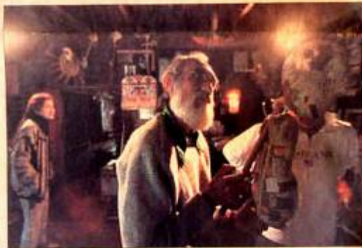
Detrás del taller de creación de títeres.