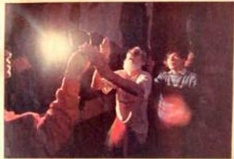
Disfrutando en el teatro y mostrando La Colibrí.