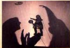
Presenta un aspecto de 'El Pueblo del Sol', última obra.