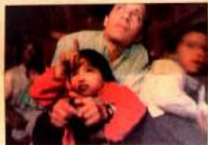
Regresó a Bolivia cada domingo.