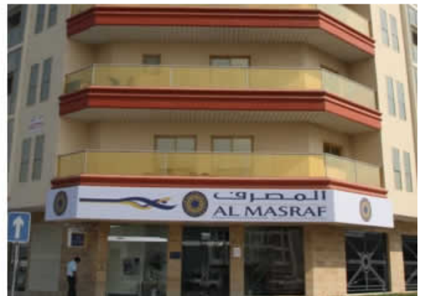
Ejemplos de aplicación en la realidad del signo de Al Masraf.