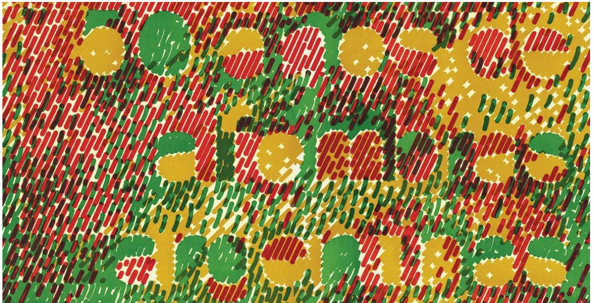
50 años de alfombras argentinas.

–No estoy seguro de que, en este momento, los medios de comunicación tengan claridad conceptual sobre el tema para hacer un aporte ni que las condiciones generales actuales de nuestra sociedad permitan comunicar la potencialidad del diseño. Una institución dedicada a proteger el patrimonio debe transmitir, con transparencia, sus objetivos a mediano y largo plazo a los comunicadores para que estos y la sociedad toda pueda relacionar la actividad vinculando indivisiblemente diseño-país-desarrollo y, de esa manera, se reconozca la credibilidad y la identidad de cada propuesta.