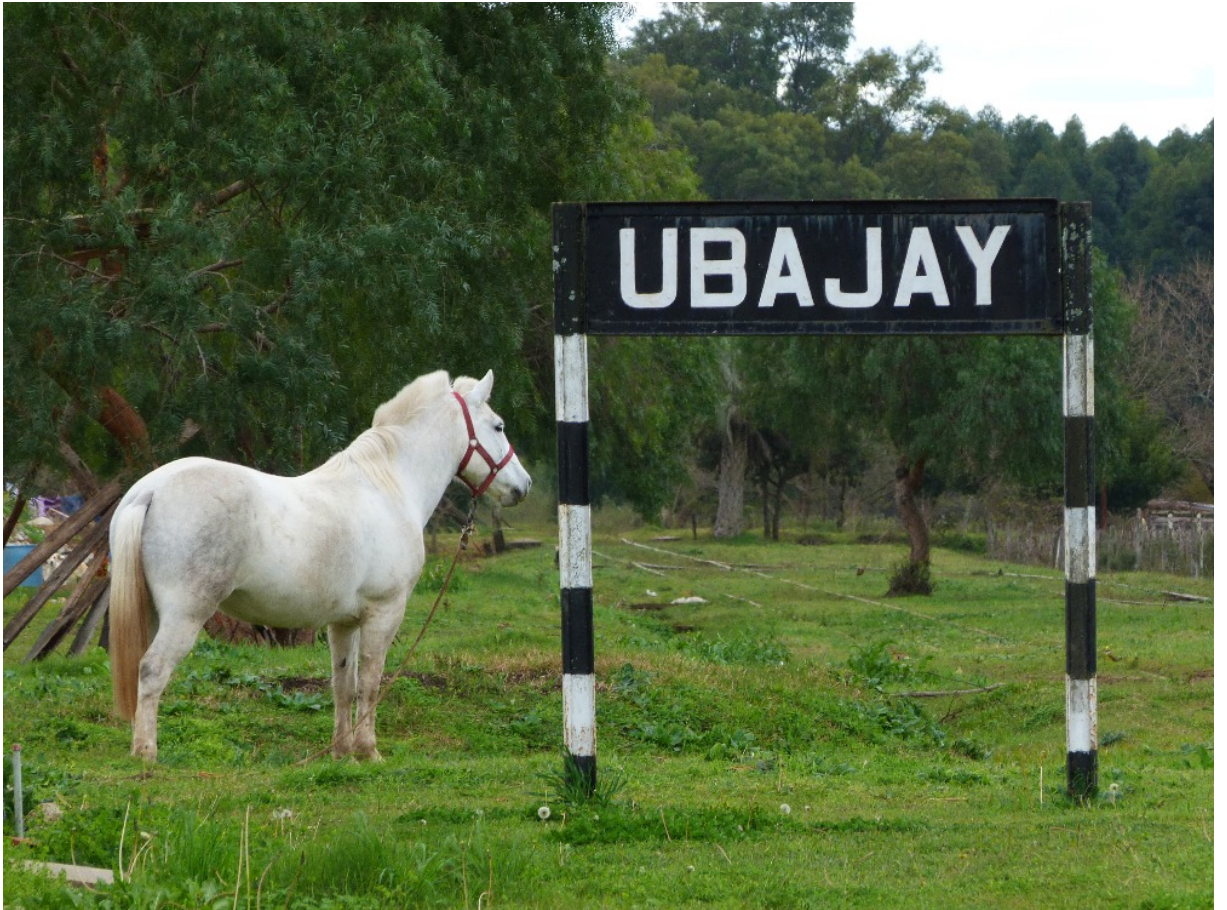
Letrero de la estación Ubajay, Entre Ríos, Ferrocarril Nordeste Argentino.