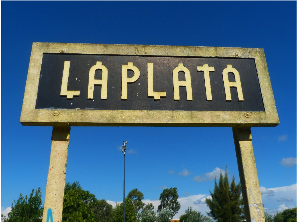
Letrero de la estación La Plata, Ferrocarril Provincial de Buenos Aires.

Por ejemplo, la letra ubicada en los letreros de hormigón armado del ramal P1 del FCPBA es muy curiosa. En parte por estar incorporada a la fragua del soporte y por lo particular de su diseño. Puede describirse como de tipo display , de caja alta y estilo constructivista, modular, de formas geométricas elementales y sin variaciones en el grosor del trazo. Sin dudas, su rasgo diferencial lo aportan los apéndices rectangulares que posee hacia las líneas de ascendentes y descendentes.