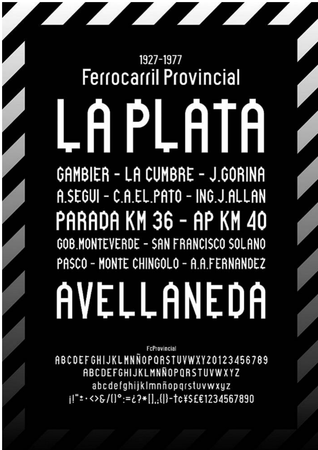
Especímen de la fuente FcProvincial.

«Estos letreros podrían estar íntimamente relacionados a los del CGBA y el FCM, porque aparte de compartir la técnica de fabricación de su soporte, podrían haberse fabricado en el mismo lugar, pues a partir del 1º de enero