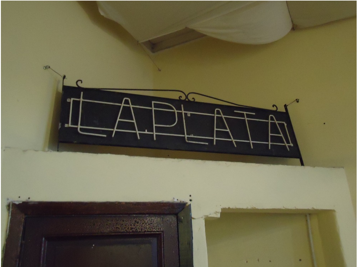
Cartel de la estación La Plata, Ferrocarril Provincial de Buenos Aires c. 1966.

Otro caso particular es el de la letra de los carteles situados en los aleros de algunas estaciones del Provincial, realizados con varillas de hierro dobladas y soldadas. Algunos testimonios recogidos durante este tiempo dan cuenta que fue realizada en los Talleres Gambier, situados en la zona de Los Hornos localidad lindera a La Plata. Es un modelo interesante para el análisis pues muestra claramente la factura nacional, la economía de recursos y la pericia de los operarios de un ferrocarril modesto de capitales nacionales.