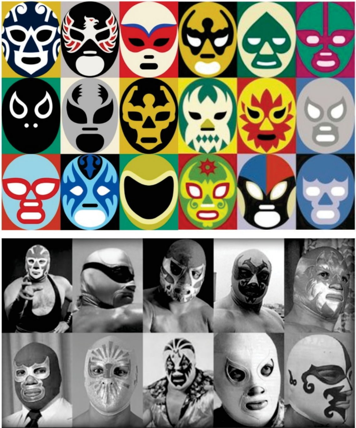
Mascaras de luchadores. Entre ellas destacan las de El Santo, Blue Demon y Místico, Mil Mascaras, Dos Caras, Huracán Ramírez, Tinieblas y Atlantis.

Aunque la máscara es el elemento más sagrado para un luchador, la vestimenta, la indumentaria, constituye su personalidad. Las capas brillantes y estampadas, las botas, las mallas, las muñequeras, no se deja detalle al azar, todo está pensado para la recreación del personaje quimérico, que en algunos casos alcanza el mito. La manufactura de cada elemento es tan precisa como cualquier indumentaria de alta costura, el luchador muestra en el ring sus mejores ropas, así pauta su poder como los antiguos guerreros prehispánicos ataviados de plumas de águila o pintados de jaguar.