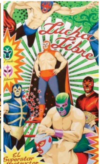
Diseño Gráfico. La inspiración de la lucha para los diseñadores gráficos, ilustradores y dibujantes se expresa en los mas diversos soportes y técnicas. Destacan los gráficos del Dr. Alderete y diversas campañas publicitarias.