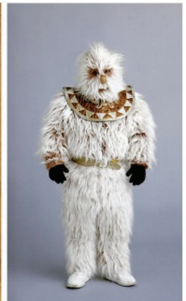
Vestimenta utilizada en el combate. Entre los ejemplos: Blue Demon Jr., Tinieblas, Maximo y Alushe.