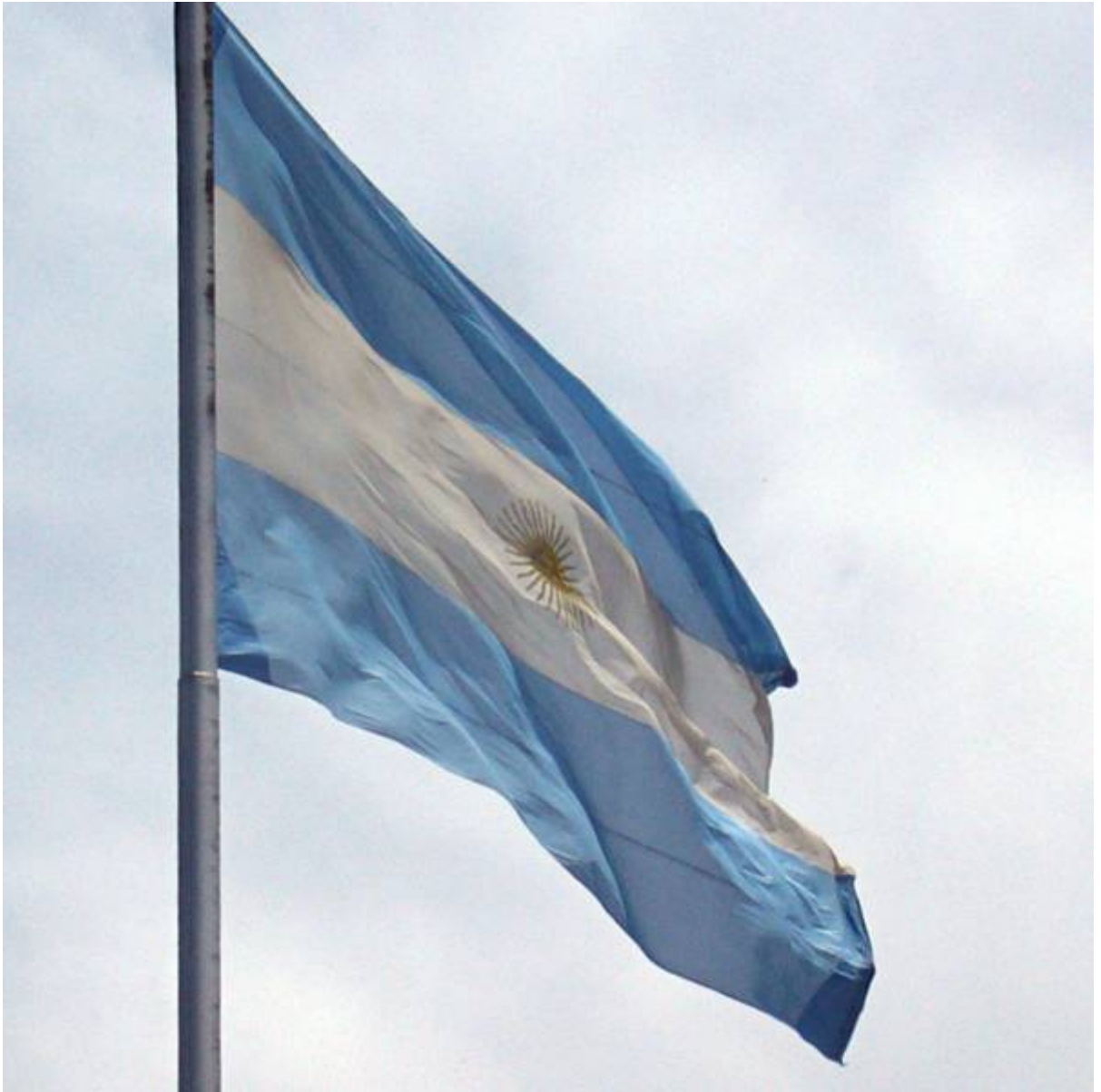
La bandera argentina

Manuel Belgrano diseñó símbolos conocidos en todo el planeta y promovió la formación de artistas visuales. Además de ser un héroe de la patria Argentina, Belgrano también merece ser elegido patrono del diseño en Latinoamérica.