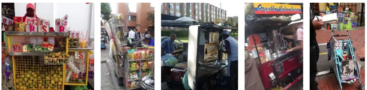
Vendedores de jugo de naranja, de golosinas, de pizza y hamburguesas, de café y de obras de arte.

Para eso entrevistamos un grupo conformado principalmente por mujeres y hombres que son vendedores ambulantes de alimentos, que han creado estructuras móviles con áreas especializadas para la exhibición del producto, almacenamiento, preparación de los alimentos, manejo de desperdicios, protección para la lluvia y hasta el cajón para guardar el dinero. Y aunque es un proyecto diferente, decidimos incluir un vendedor de obras de arte que decidió transformar el coche de su hija en una vitrina itinerante.