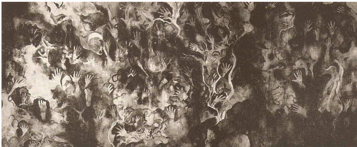
Caverna de Cap Abba, Darenbang (Nueva Guinea). Impresiones de manos.

Por otra parte, si□, son bien visibles los hormigueros de manos estampadas contra paredes y techos de las grutas prehisto□ricas, en A□frica, Europa y Asia. Ellas son el testigo clamoroso de la autoconsciencia ya presente en erectus : «mi mano es el signo de mi identidad; yo he estado aqui□» (como la pisada del astronauta). Pero no solo eso. Ese gesto descubre el ingenio de nuestros antepasados por generar ima□genes. Y ma□s concretamente, revela la invencio□n de una te□cnica: el marcaje , embrio□n de la copia mu□ltiple de los artistas grabadores, premonicio□n de la imprenta, de las marcas de fa□brica y de comercio, y de los frottages de los artistas pla□sticos.