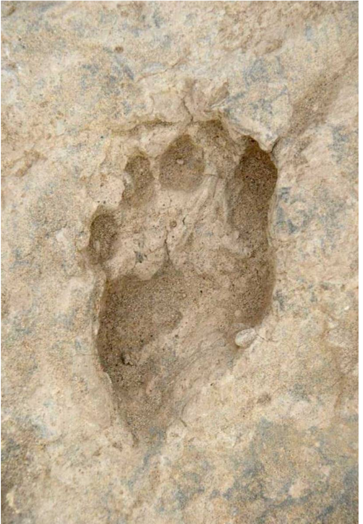
3,5 millones de años, huella de pie humano.