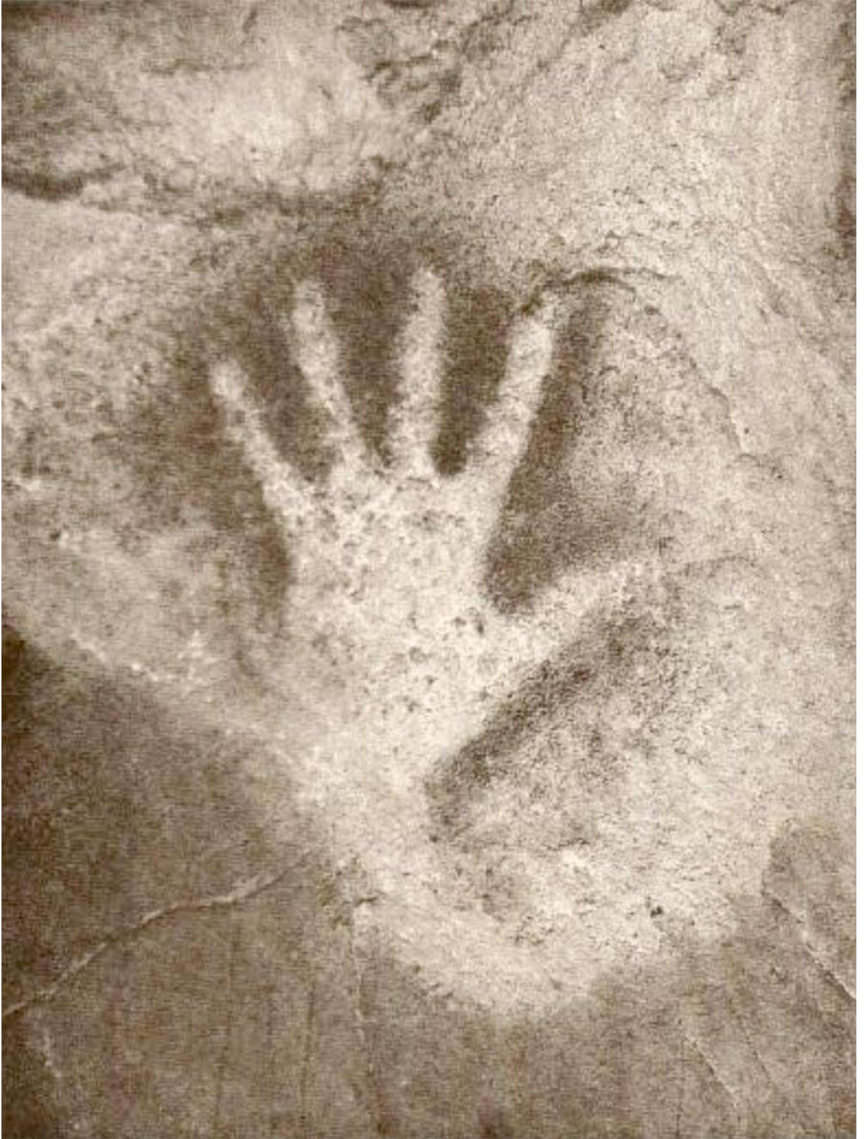
El Castillo: mano izquierda.