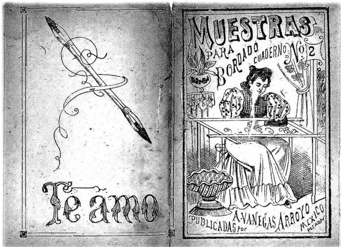
Cuadernillo de Muestras para Bordado, Cuaderno N° 2, ilustrado por Posada cuando trabajó en la Editorial Vanegas Arroyo.

Al estudiar los orígenes de la iconografía de Posada se perciben sus conocimientos y la formación visual basada en la observación de los hechos populares de su época y en la «alta cultura» accesible entonces, por transmisión oral y escrita de ideas y técnicas o el trato cotidiano con amigos y compañeros de trabajo ilustrados. El siglo XIX es el siglo de oro del arte popular. Al liquidarse las ideas absolutistas del poder divino de los gobernadores, nacieron las libertades de pensamiento, políticas, sociales, religiosas, que suscitaron la libertad de expresión y de creación. Los artistas representaron sin censura sus conceptos plásticos, emancipándose de las rígidas tradiciones impuestas por el despotismo del Estado y la Iglesia. Posada además trabajó conceptos populares importantes en esa época: los cancioneros o corridos, así como los cuentos clásicos infantiles.