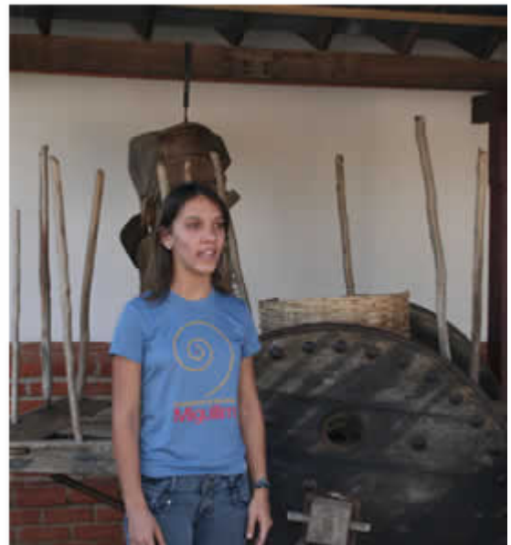
Artesanía rosiana; Interior y exterior de la Casa de la Cultura, homenajeando al Morro que da nombre al cuento y una de las Contadoras de Estórias Miguilim.

Lo destacable de esta experiencia es que un abordaje erudito de la literatura produce un diseño sumamente efectivo para la población, y que coloca al interior de Brasil como una matriz relevante para dar identidad al país. En Sao Paulo, ya dentro de la esfera urbana, esta matriz del interior seco y rural del Sertón ha motivado también obras de diseño arquitectónico como el centro cultural SESC Pompeia, uno de los más visitados por la población.