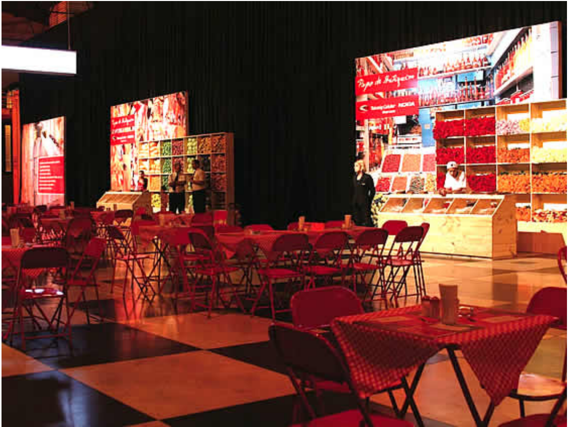
Guía Marketing Promocional, MG. Ambiente informal para aproximar a una empresa con sus clientes, año 2003.

O bien conocimos el diseño hecho para el metro de París, en la Semana de Brasil en Francia, donde los parisinos se confrontaban con la vida de una «favela» al salir del vagón.