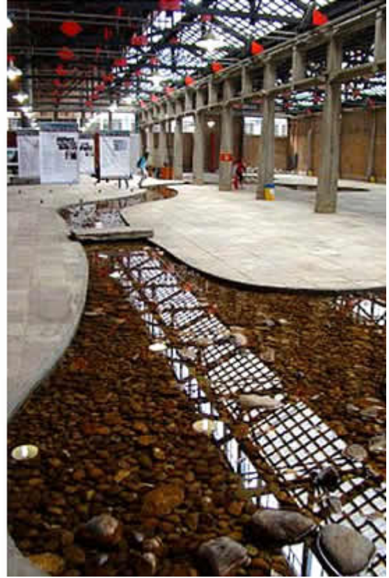
Lina do Bardi, SESC-Fábrica Pomepia, Sao Paulo.