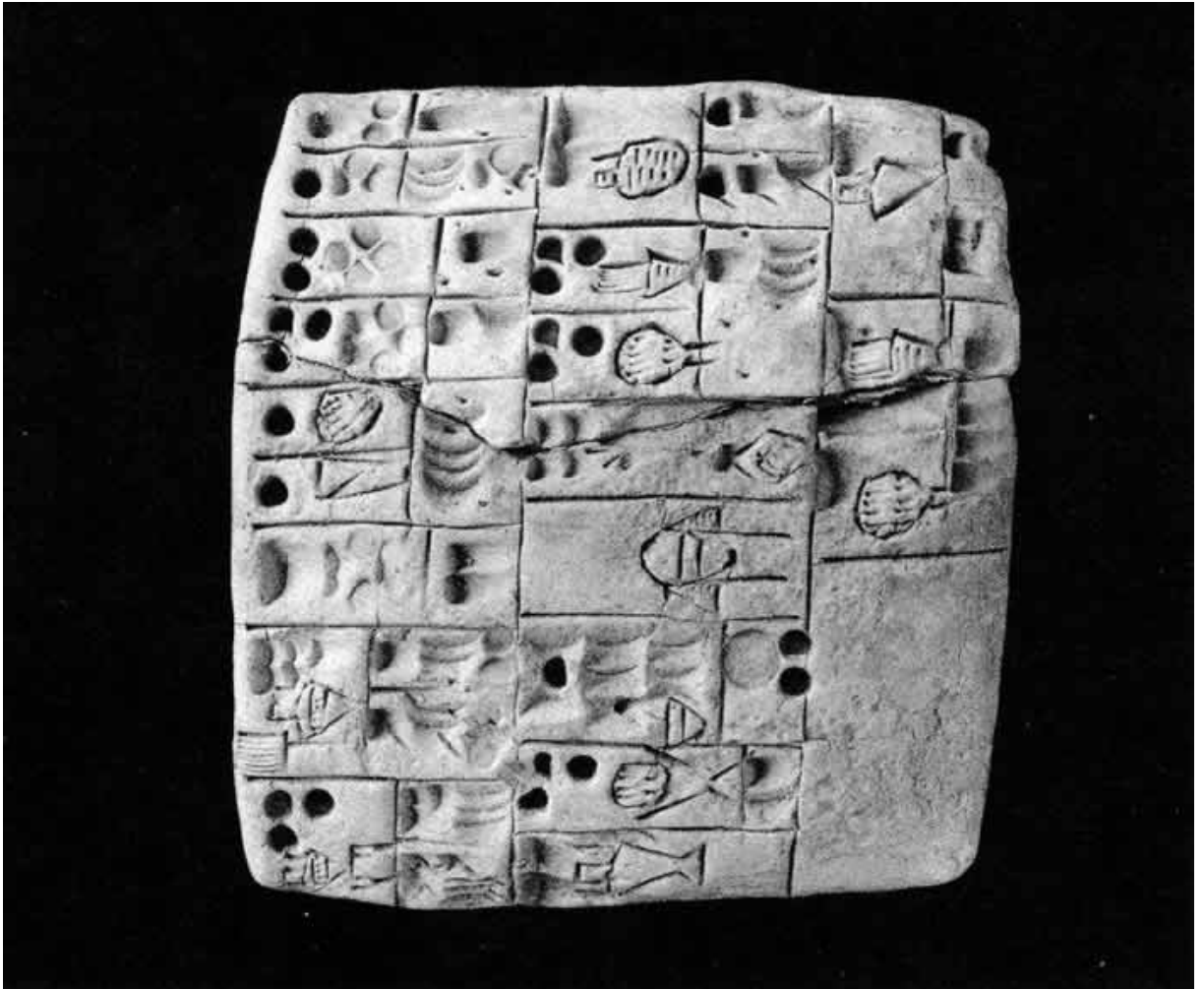
Tableta mesopotámica de arcilla usada para cuestiones administrativas.

La idea de las tabletas de arcilla fue probablemente consecuencia de la creciente complejidad económica de las ciudades estado mesopotámicas, en una época de pujanza no sólo material sino sobre todo cultural. Los habitantes de las ciudades del antiguo Irak (hoy invadido, saqueado y destruido miserablemente) usaban el material más abundante de su tierra: la arcilla, dada la escasez de piedra o madera. La arcilla es, además, relativamente fácil de marcar y de borrar cuando se comete un error, y una vez seca o cocida, es indeleble.