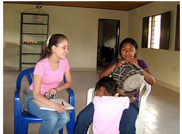
A la izquierda, diálogo participativo con Asociación Atikinchukwa (foto: Iván Darío Castro). A la derecha, Trueque de Conocimientos y acciones (foto: Iván Darío Castro)

Tejer pensamiento colectivo es inevitable si nos convertimos en actores comprometidos a desarrollar proyectos con sentido y fundamento, que permitan la proyección cultural adecuada de las comunidades. Mi deseo es que potenciemos y repliquemos este modelo en otros ámbitos de la profesión, ya que es nuestra tarea tejer puntadas de pensamiento colectivo que nos identifiquen como diseñadores activos y consientes de la presencia humana de nuestros proyectos.