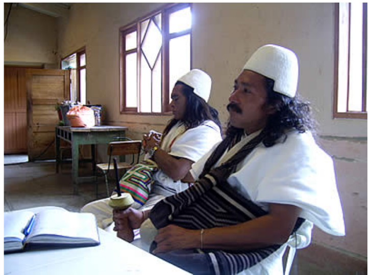
A la izquierda, mujer Arhuaca tejiendo mochila (foto: Angélica Vásquez). A la derecha, indígenas Arhuacos en espacio de diálogo (foto: Angélica Vásquez).

En el camino y para mi asombro, pude acercarme y percibir a los estudiantes de diseño industrial de la UJTL, del grupo de Investigación proyecto de grado (IPG). La llamada Tribu Tinkuy —curiosamente denominada comunidad en lengua Quechua— dentro de dinámicas de diseño colectivo en el aula, fomentó diálogos respetuosos, críticas constructivas, aportes y sugerencias mediante talleres que generaron propuestas proyectuales integrales y soportadas en procesos participativos, junto con los principales actores involucrados.