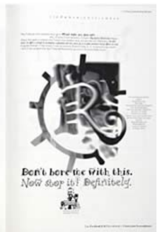
Portadas e interiores de la revista Emigre.