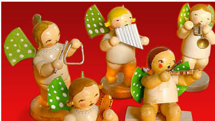
Angelitos músicos. Artesanía navideña en madera policromada, Alemania, circa 1950.

Al diseñar los «klicky» —los característicos muñequitos articulados, iconos de la marca— Hans Beck parece haberse inspirado en la rica tradición artesanal germana destinada a los niños, manifestada en multitud de artículos navideños y juguetes artesanales, basados en la simplicidad morfológica y la riqueza cromática. Beck logra encanto y expresividad con mínimos recursos formales de matriz geométrica: cuerpos estilizados con brazos y piernas móviles; caritas redondas desprovistas de nariz, con grandes ojos y afables sonrisas de medialuna; manos aptas para asir accesorios diversos que identifican la enorme variedad de actividades humanas representadas en los sets .