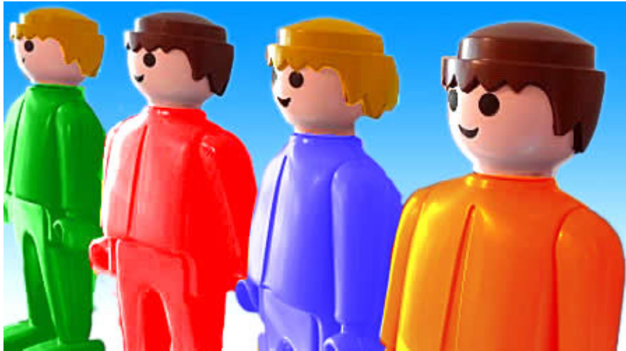
«Klicky» de «playmobil». Diseño de Hans Beck, Alemania, circa 1972.

Los diseñadores podemos apreciar la excelencia de forma y función de estos juguetes por su extraordinaria versatilidad en su aparente simplicidad. Desde una perspectiva comercial, por la resistencia al uso intensivo al que son sometidos los productos por parte de los implacables usuarios infantiles, representan casi una paradoja del marketing contemporáneo: nada de «obsolescencia programada». Son juguetes «programados» para durar.