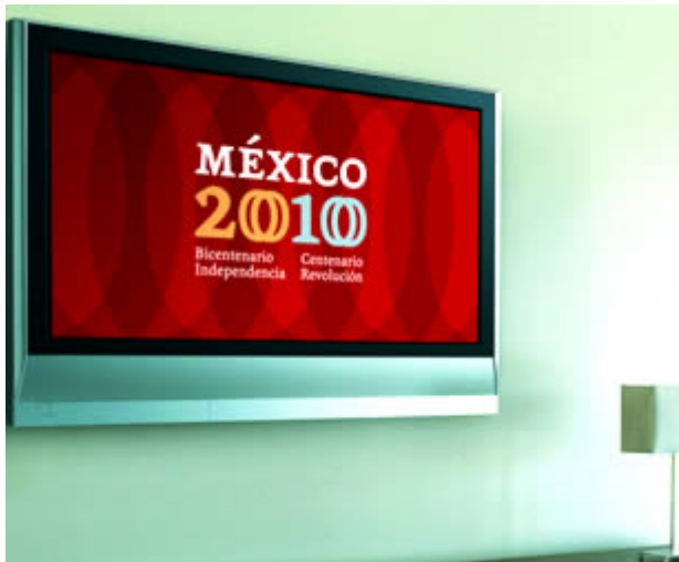
Presentación en pantalla de la firma y el estilo visual