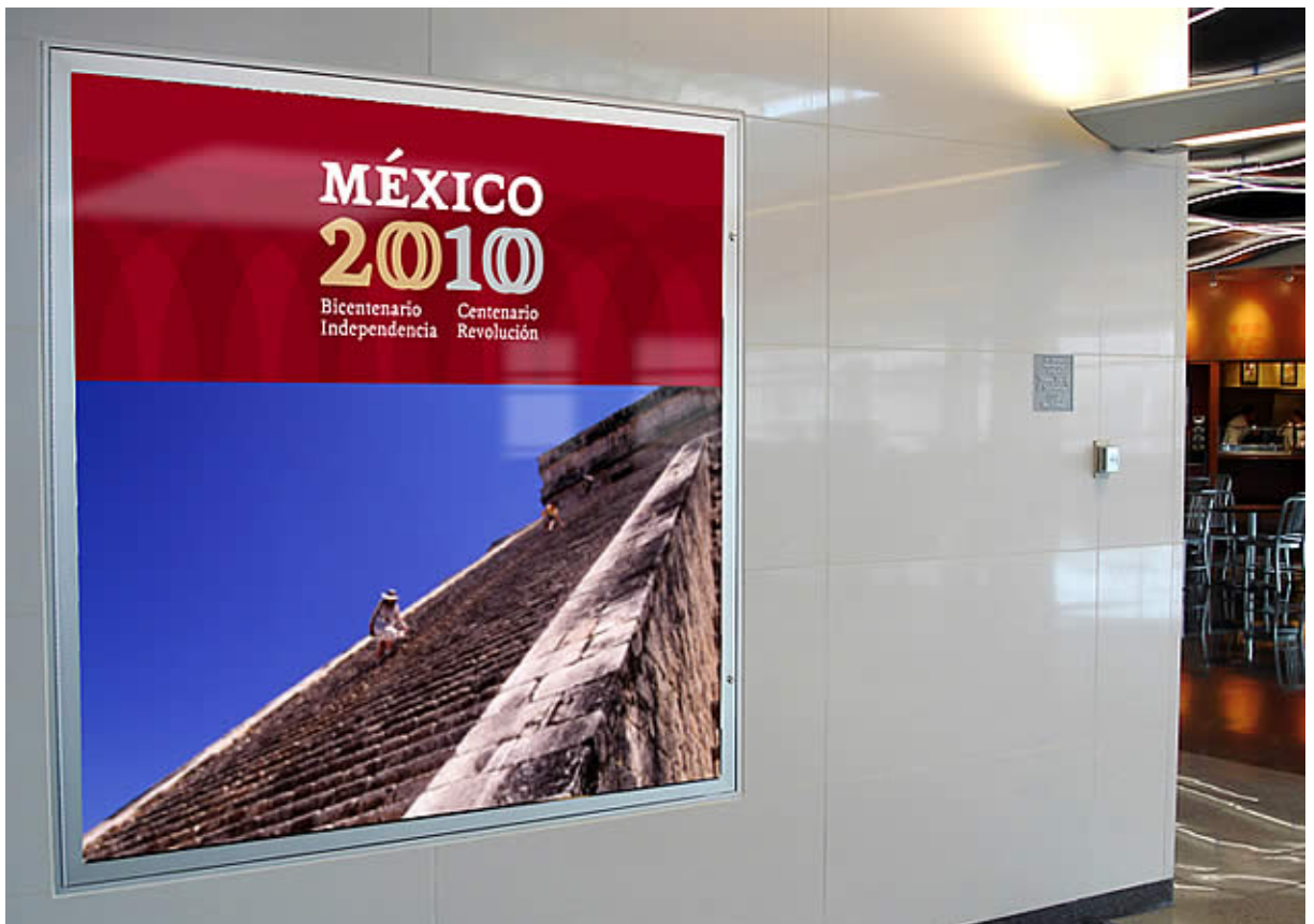
Cartelera promocional para aeropuerto