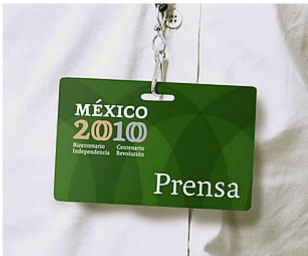
Credencial para personal de prensa a eventos oficiales