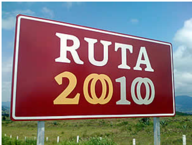
Señalización de caminos y carreteras a lo largo y ancho de México de destinos ligados a las fechas conmemoradas titulados como «Ruta 2010»