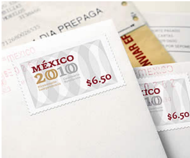
Estampilla de correos conmemorativa