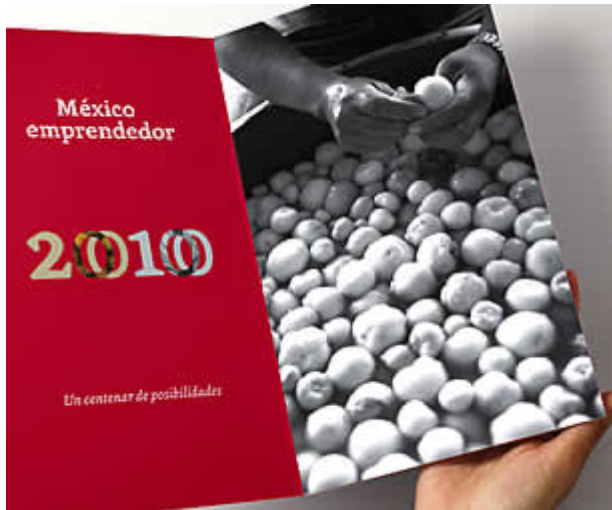
Folleto institucional que promueve eventos ligados a la temática de la conmemoración