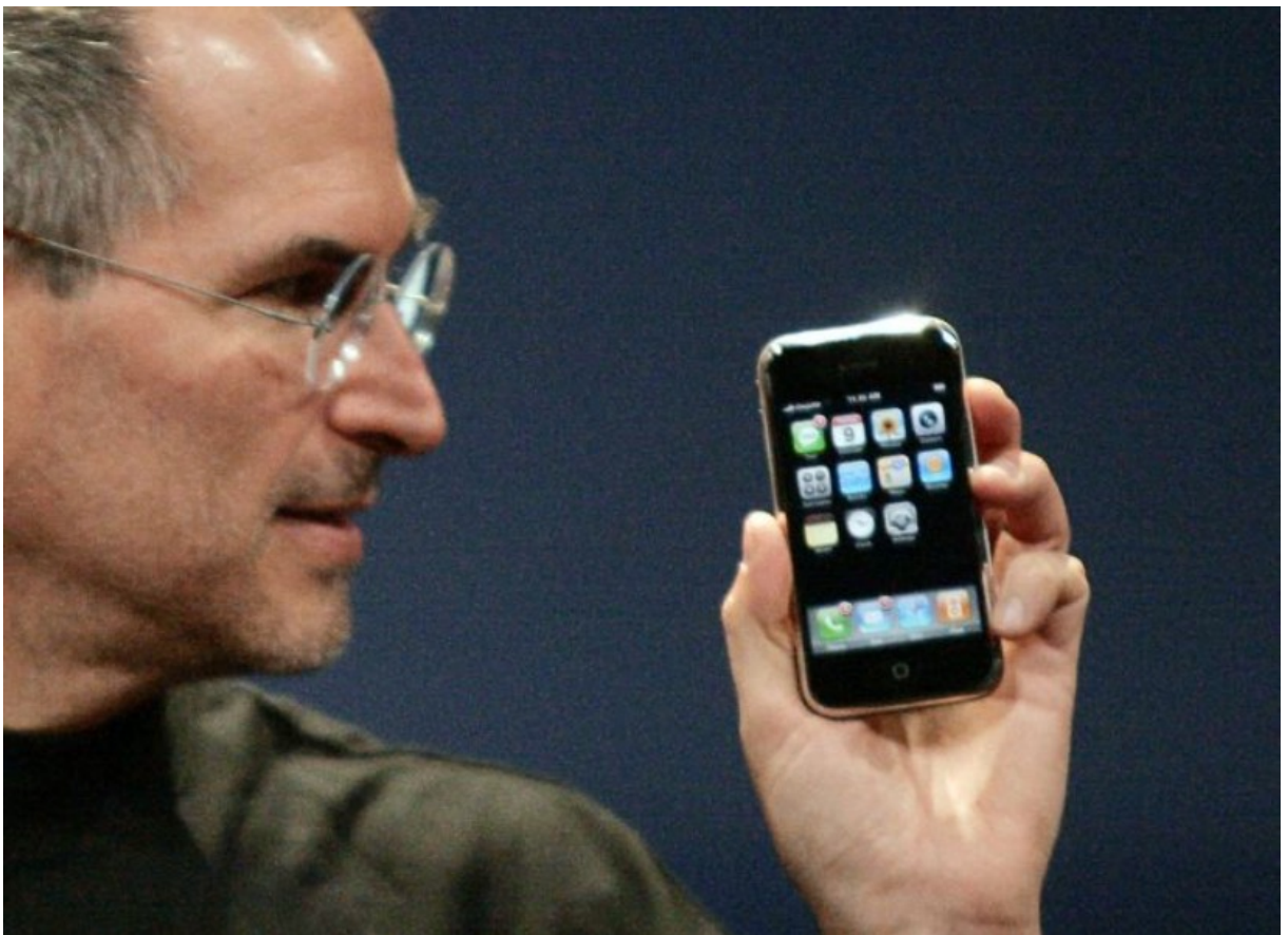
Steve Jobs apresentando o iPhone em 2007

Dez anos após esses dois fatos, a Apple Computadores é a empresa mais valiosa do setor de informática no mundo, ultrapassando a própria DELL no ranking de fabricantes com maior atividade rentável do setor. Michael Dell teve de repensar as próprias palavras, e a imprensa especializada assistia, de forma cética, nos anos a seguir, o lançamento dois produtos inovadores: o iPhone (2007) e o iPad (2010). Três anos após seu lançamento, o iPhone toma o mercado de usuários corporativos da então gigante canadense RIM. Surpresa? Nenhuma, do ponto de vista de Jobs. 2