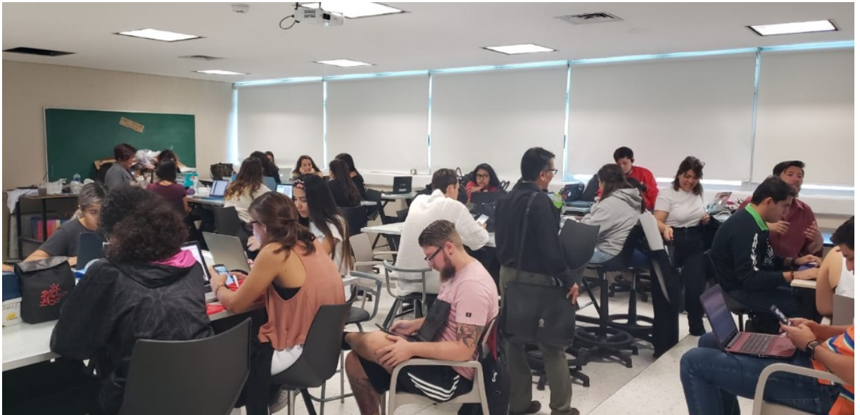
Workshop en una de las aulas de la Universidad.