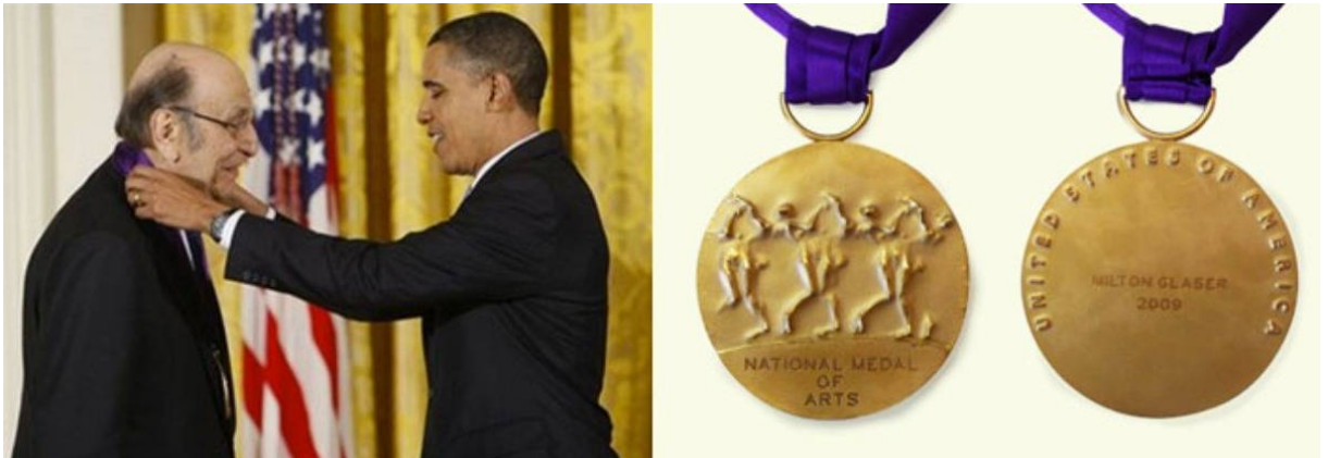
Glaser recibe la Medalla Nacional de las Artes.

Museo Nacional de Diseño Cooper-Hewitt, en 2009 se convirtió en el primer diseñador gráfico en recibir –de manos de Barack Obama– la Medalla Nacional de las Artes.