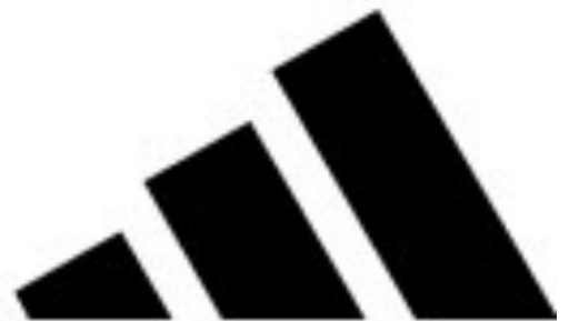
Símbolos de Timberland y Adidas.