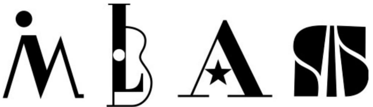
Símbolos de Ibermedia, Oficina Leo Brouwer, Academia Cubana de la Lengua y Autopistas del Sur de Francia.

Otro elemento que complejiza la clasificación de los símbolos es la presencia de diversos casos mixtos o con algún grado de «mestizaje tipológico», que mezclan elementos gráficos de diferente naturaleza en un mismo símbolo identificador. Por ejemplo, el personaje de IBERMEDIA construido a partir de las letras M e I, la guitarra de la Oficina Leo Brouwer, diseñada a partir de las iniciales L y B, la letra A con la estrella como travesaño de la Academia Cubana de la Lengua y la letra S de Autopistas del Sur de Francia.