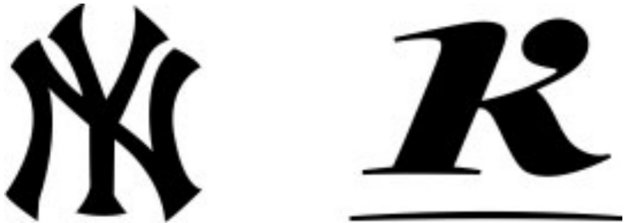
Símbolos de Yanquis de NY y KONFORT.

composición entre ellos se corresponde también con un código ampliamente conocido: el monograma.