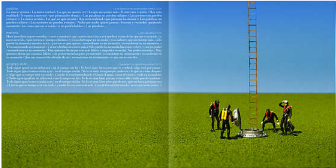
Interior del disco.