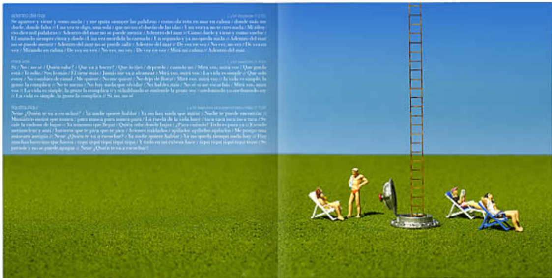
Interior del disco