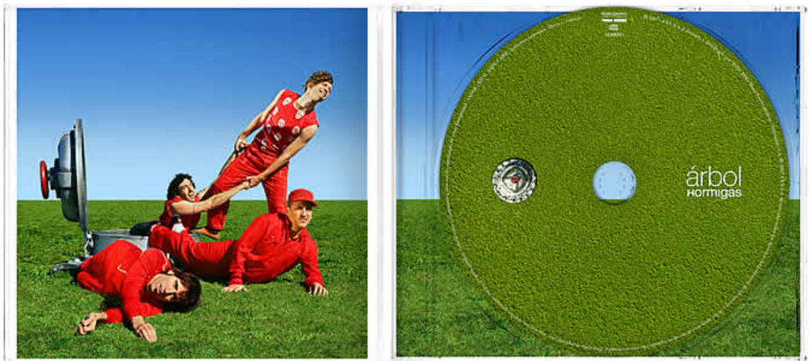
Interior del disco.