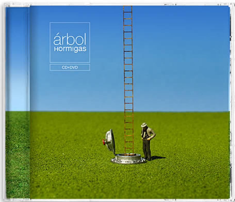
Tapa del disco «Hormigas», Arbol.