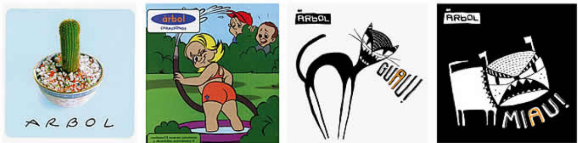
Discografía previa de Árbol.

Para profundizar la era de cambios fue muy importante ser conscientes de la imagen que el grupo venía desarrollando. Sus últimos tres trabajos habían sido realizados con ilustraciones y en este caso se buscaba generar un quiebre estético.