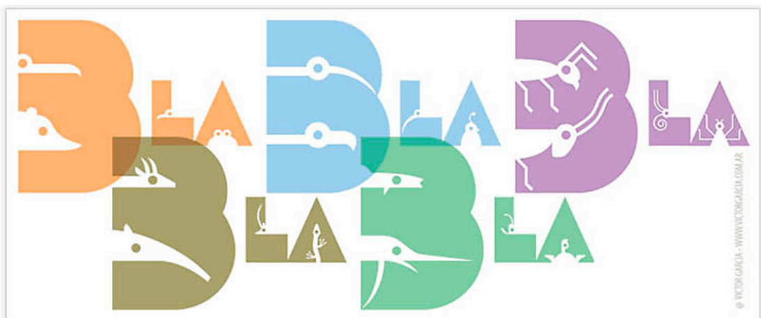
La «B» en Zootype Regular (1997); Zootype Air (1998/99); Zootype Bugs (2012/13, inédita), arriba; Zootype Land , Zootype Water (1998/99), abajo.

El desafío es múltiple y los objetivos ciertamente ambiciosos y posiblemente quiméricos: por un lado, desarrollar temas relacionados con las características formales y conceptuales de una familia tipográfica con una personalidad tan definida; que esos temas puedan resultar interesantes y de amplio espectro dentro de sus evidentes limitaciones temáticas; apelar a la inteligencia y la complicitad de un lector perspicaz y curioso; y por último –y quizás lo más difícil en este impredecible safari–, que el carácter manifiestamente monotemático de la misma propuesta no implique que el contenido de los artículos deba ser necesariamente monótono ni monocorde. De algún modo una paradoja, pues un observador atento podría alegar con razón que algunos caracteres de Zootype están habitados por monos.