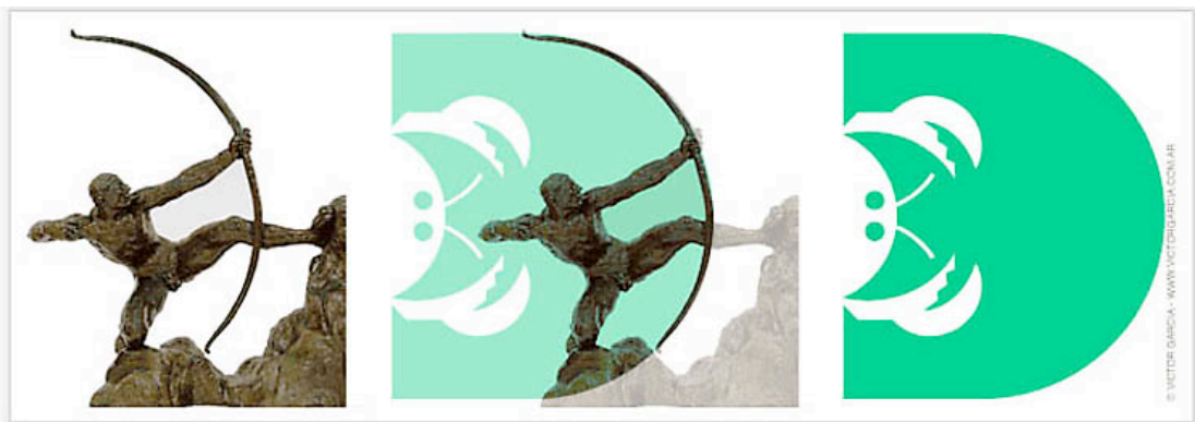
Hipótesis alternativa 2 c): La «D» inspirada en la morfología del arco. Zootype «D» y Heracles arquero , de Emile Antoine Bourdelle..

Para el tratamiento visual, me limité a seleccionar uno de los formatos predeterminados de puesta en página que ofrece Blogger de Google y decidí concentrarme para cada artículo en el diseño de imágenes atractivas a partir del empleo intensivo de frases usando exclusivamente las fuentes Zootype .